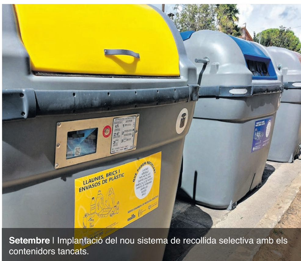
Setembre | Implantació del nou sistema de recollida selectiva amb els contenidors tancats.