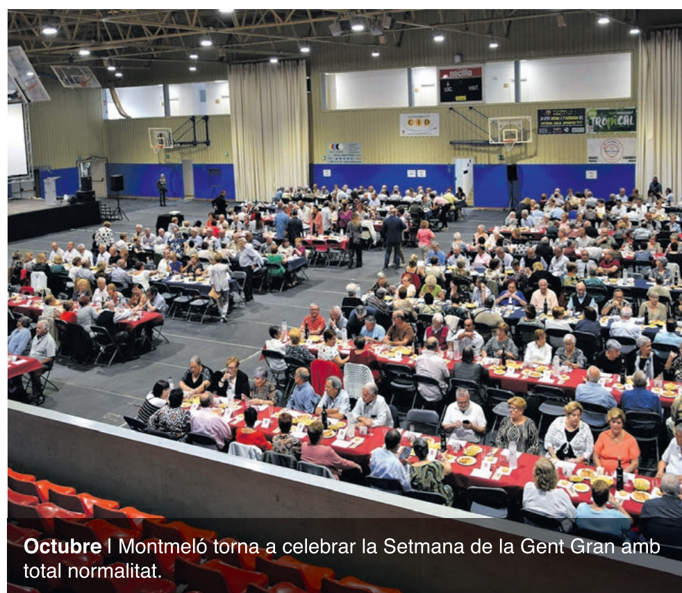
Octubre | Montmeló torna a celebrar la Setmana de la Gent Gran amb total normalitat.