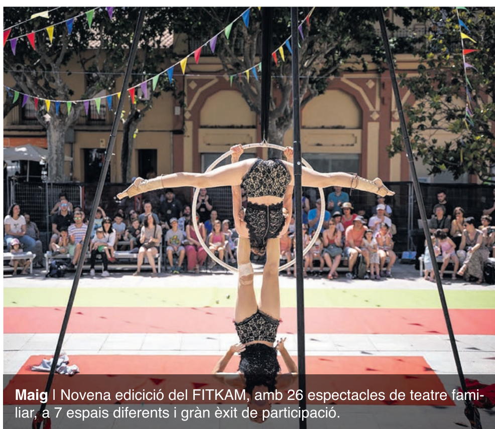
Maig | Novena edició del FITKAM, amb 26 espectacles de teatre familiar, a 7 espais diferents i grànd èxit de participació.