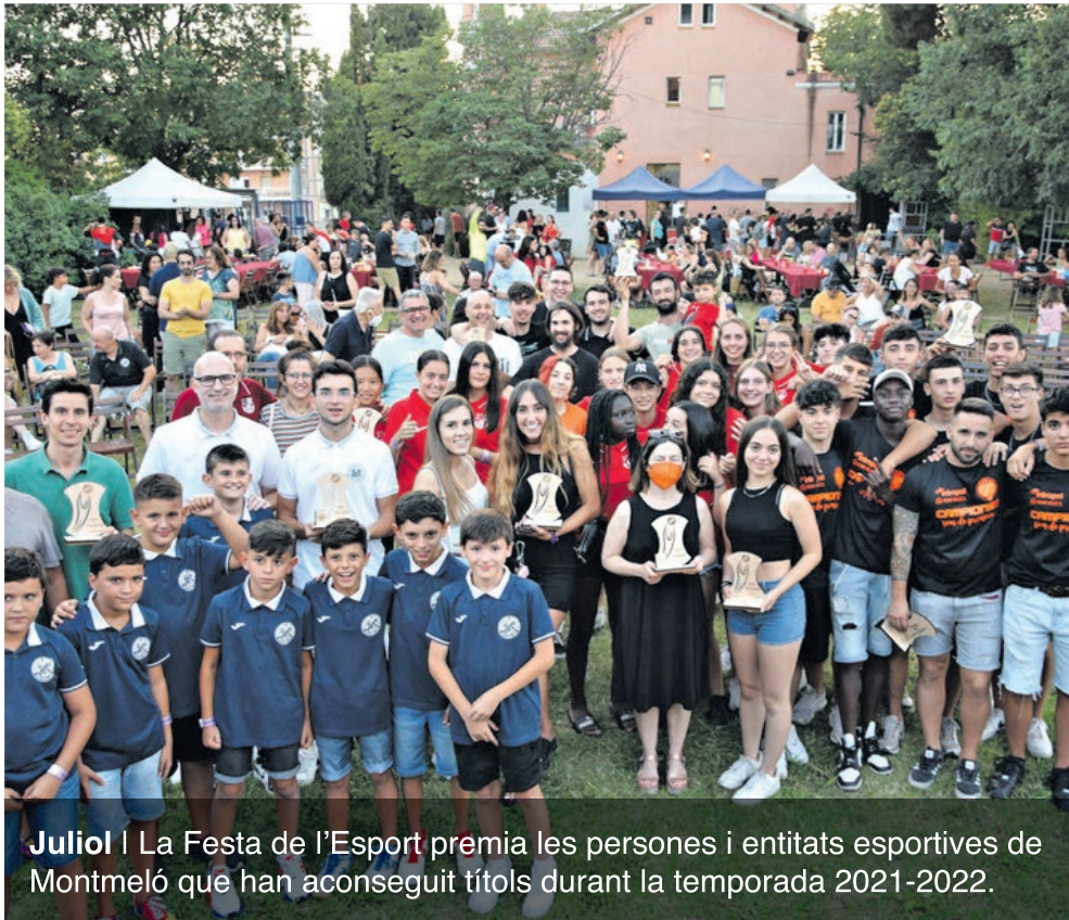
Juliol | La Festa de l'Esport premia les persones i entitats esportives de Montmeló que han aconseguit títols durant la temporada 2021-2022.