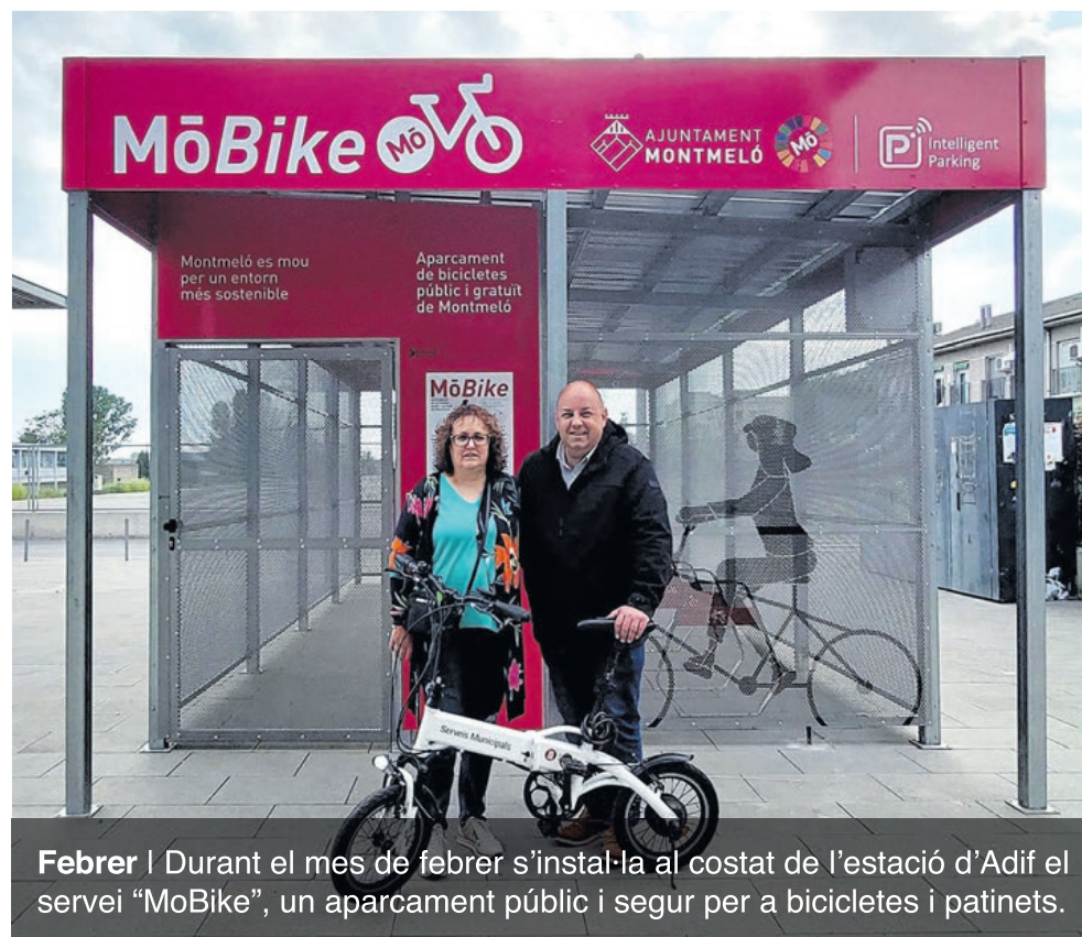
Febrer | Durant el mes de febrer s'instal·la al costat de l'estació d'Adif el servei "MoBike", un aparcament públic i segur per a bicicletes i patinets.