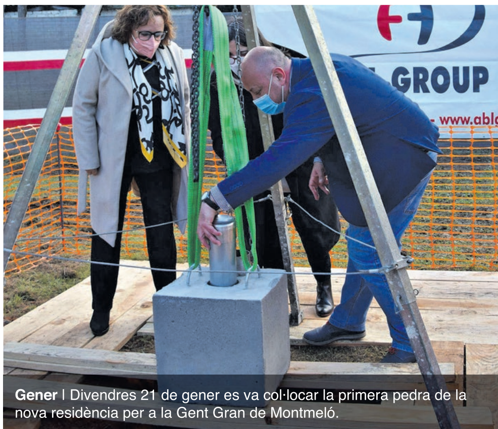
Gener | Divendres 21 de gener es va col·locar la primera pedra de la nova residència per a la Gent Gran de Montmeló.