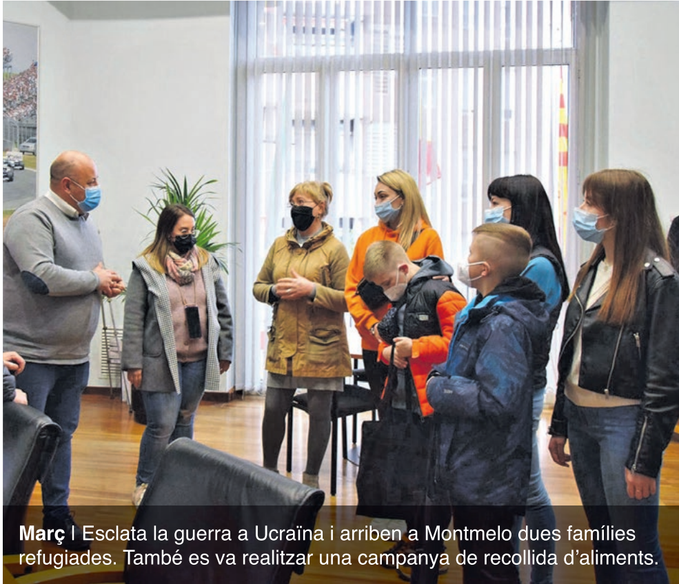
Març | Esclata la guerra a Ucraïna i arriben a Montmeló dues famílies refugiades. També es va realitzar una campanya de recollida d'aliments.