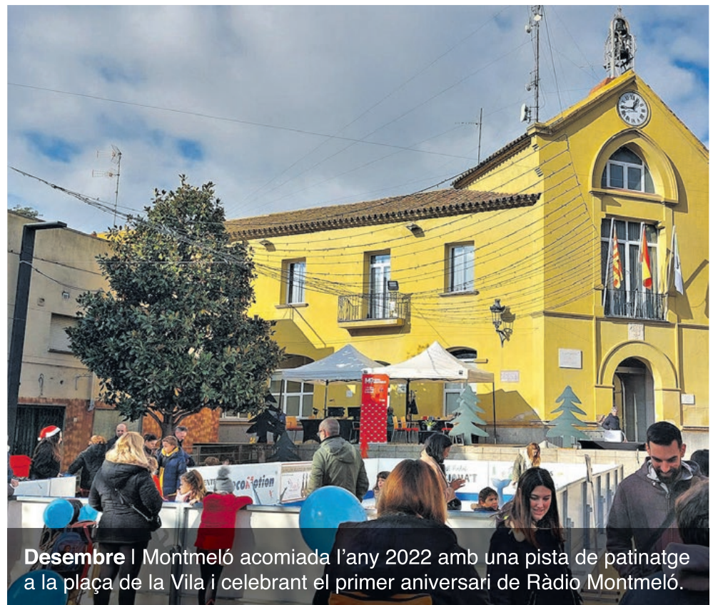
Desembre | Montmeló acomiada l'any 2022 amb una pista de patinatge a la plaça de la Vila i celebrant el primer aniversari de Ràdio Montmeló.