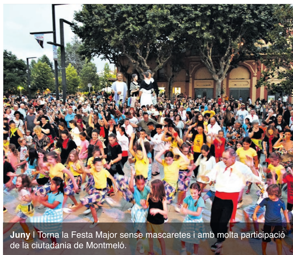
Juny | Torna la Festa Major sense mascaretes i amb molta participació de la ciutadania de Montmeló.