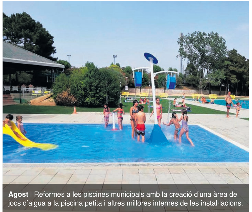
Agost | Reformes a les piscines municipals amb la creació d'una àrea de jocs d'aigua a la piscina petita i altres millores internes de les instal·lacions.