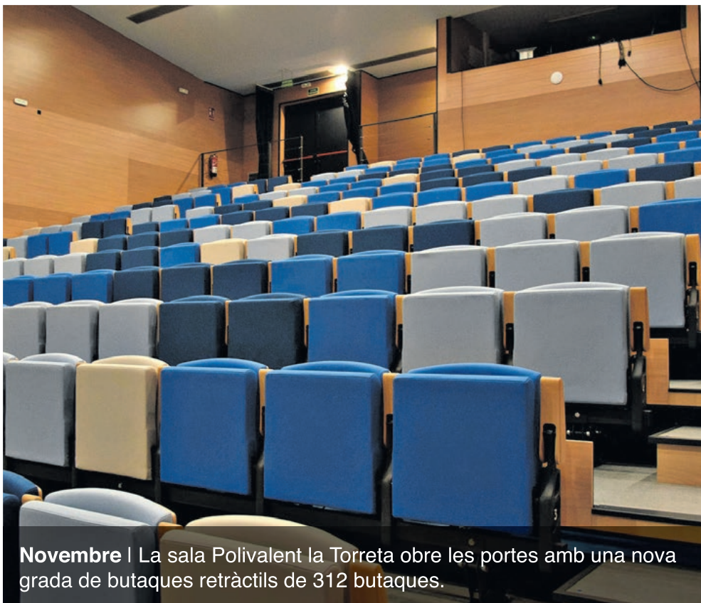
Novembre | La sala Polivalent la Torreta obre les portes amb una nova grada de butaques retràctils de 312 butaques.