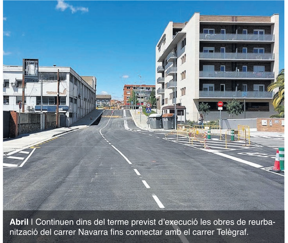
Abril | Continuen dins del terme previst d'execució les obres de reurbanització del carrer Navarra fins connectar amb el carrer Telègraf.