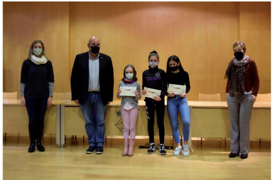
Lliurament de premis dels concursos de postal i video-postal