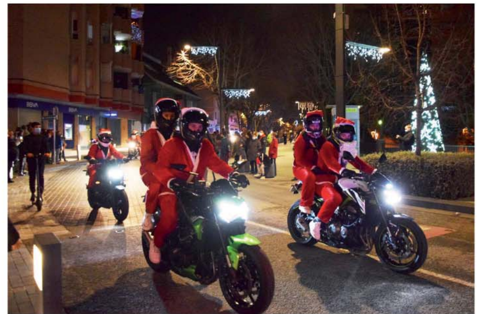
Papanoelada de "Moters Montmeló"