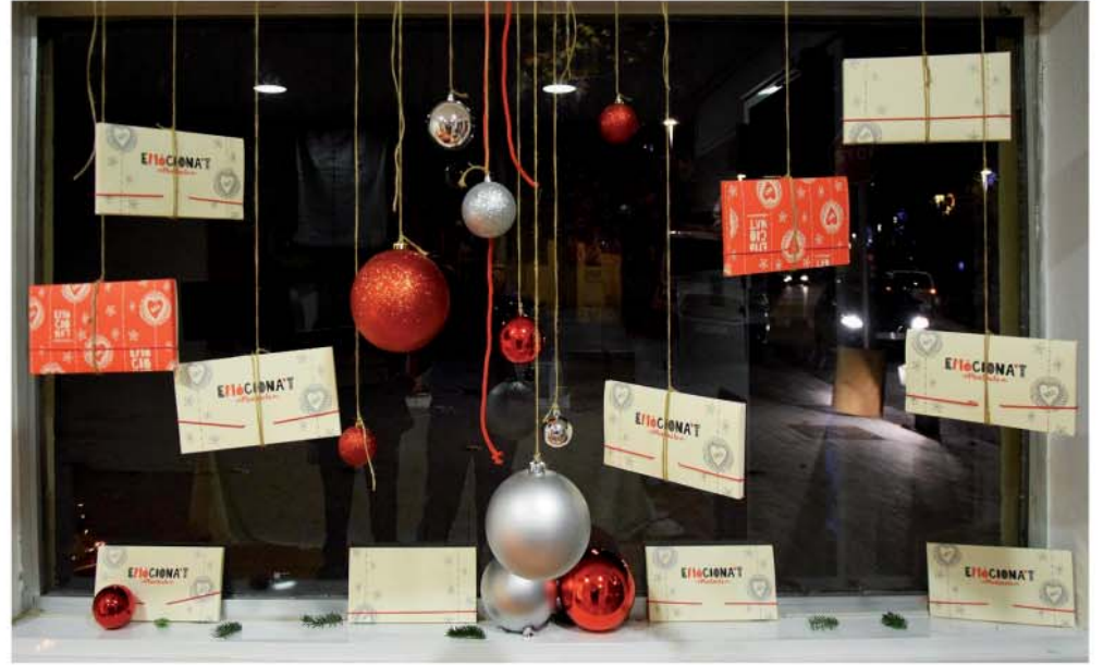
Botiga municipal "Emocionat"