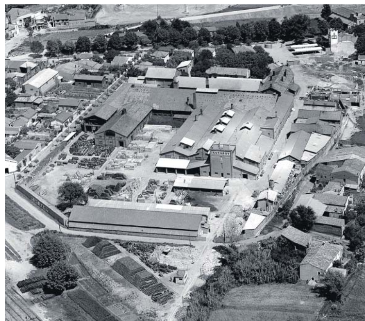
Vista aérea de la fábrica Cucurny de Montmeló

El equipo organizador recuerda que en los dos actos será obligatorio el uso de la mascarilla y respetar la distancia de seguridad entre las personas asistentes. ■