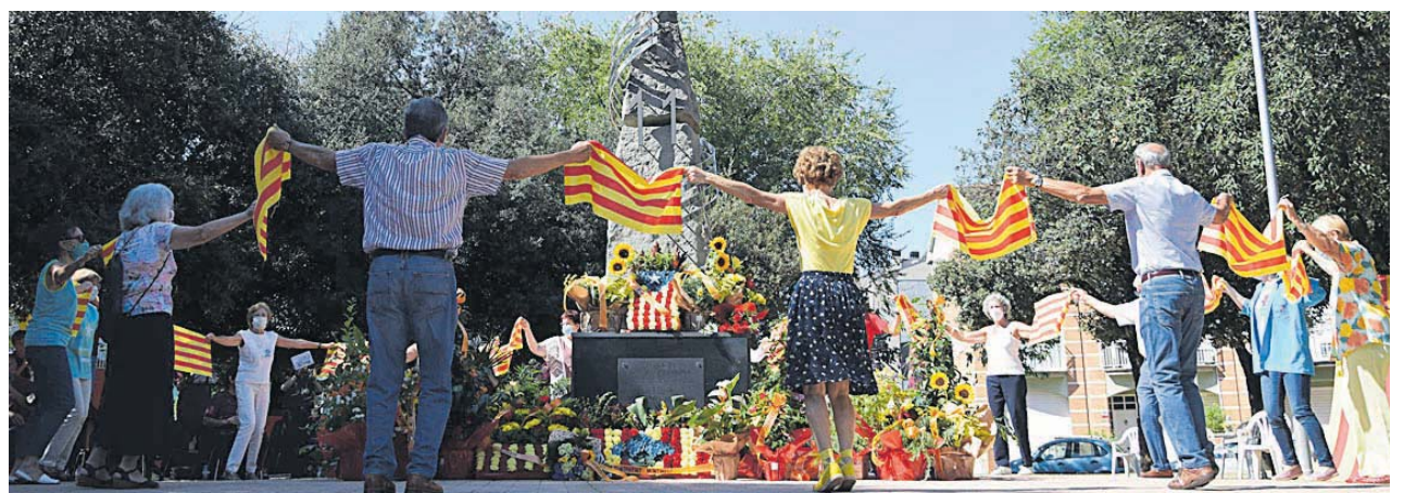
Ballada de sardanes