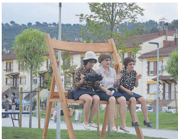
Espectacle a la Fresca, a la nova plaça de la Constitució