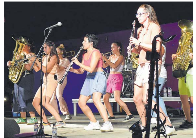
Les Balkan Paradise Orchestra