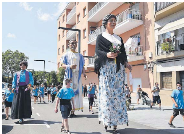
Passejada dels Gegants de Montmeló