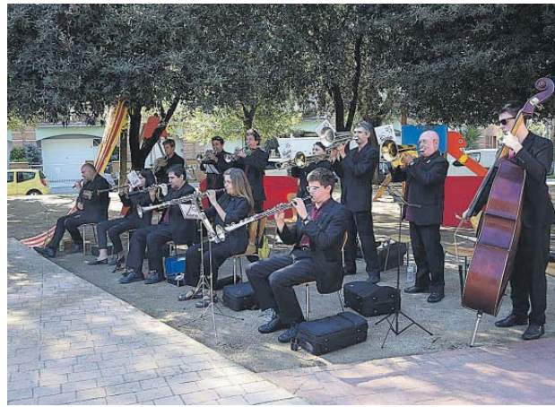
Sardanes amb la Cobla Súria

L'acte va començar amb una versió de la coneguda Bella Ciao i tot seguit es va procedir a la hissada de l'estelada amb el cant de la senyera. La poesia també va estar present en aquesta celebració. Per cloure l'acte es va llegir una carta del president d'Òmnium Cultural Jordi Cuixart.