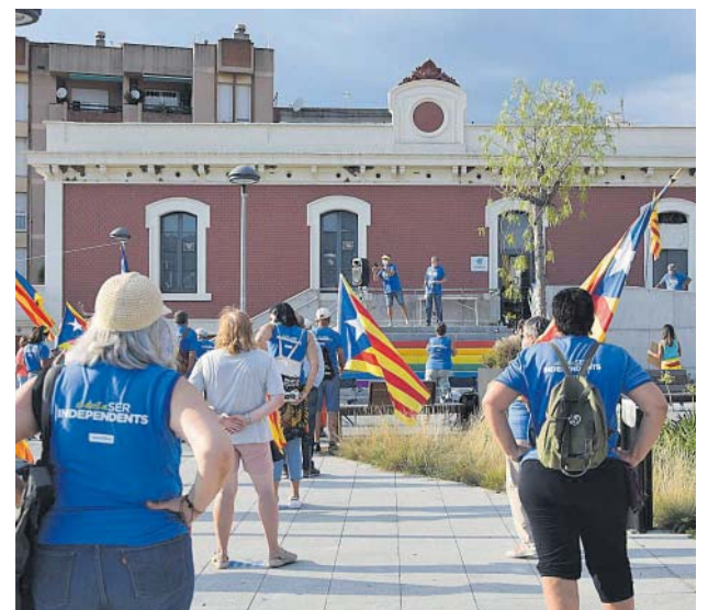
Concentració a la Llosa