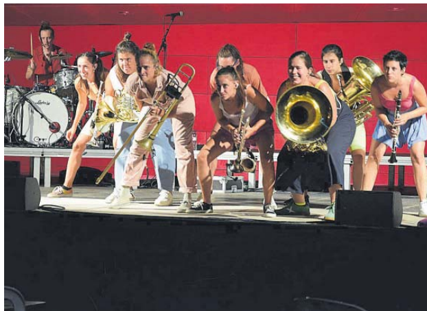
Les Balkan Paradise Orchestra