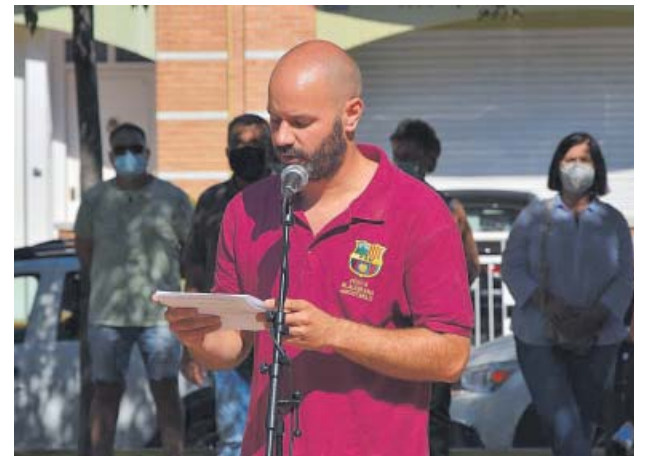
Parlament del president de la Penya Blaugrana