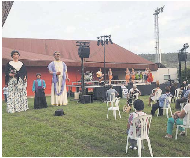
Havaneres: Les Anxovetes

Diumenge va ser el torn de l'espectacle a la plaça de la Cucurny, que va portar el toc d'humor a la festa fent riure a grans i petits. La festa va acabar amb l'espectacle Somnis de Sorra, que va omplir la Sala Polivalent emmudint el públic i transportant-lo a diferents llocs del món i per diverses històries.