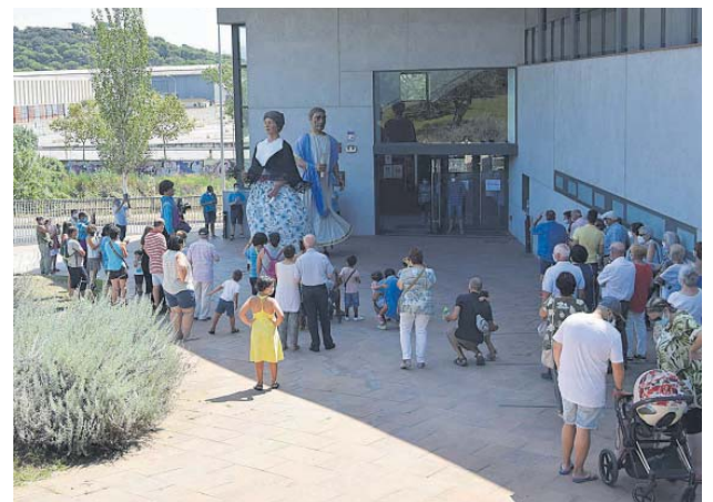
Ballada dels Gegants de Montmeló