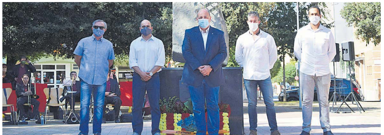
Ofrena floral del representants polítics de l'Ajuntament de Montmeló