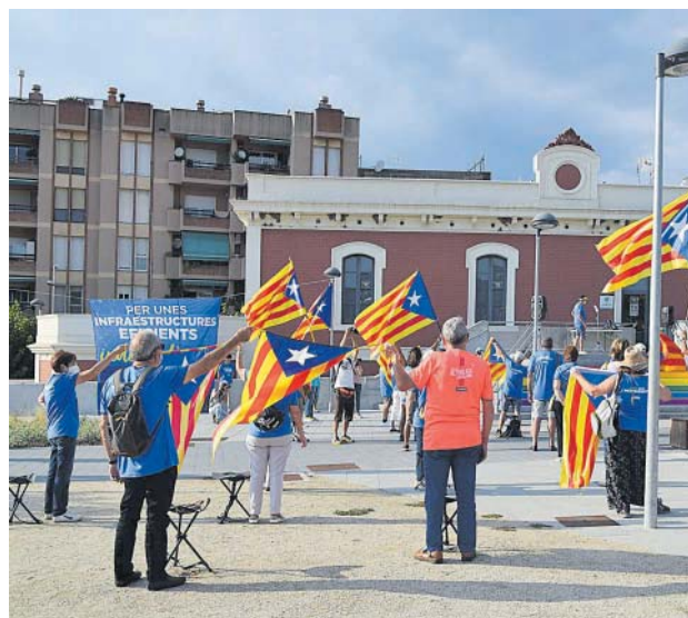
Concentració a la Llosa