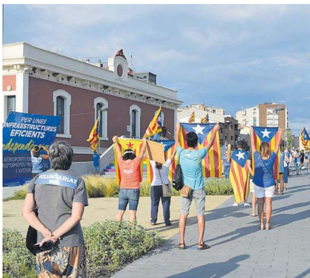
Concentració a la Llosa