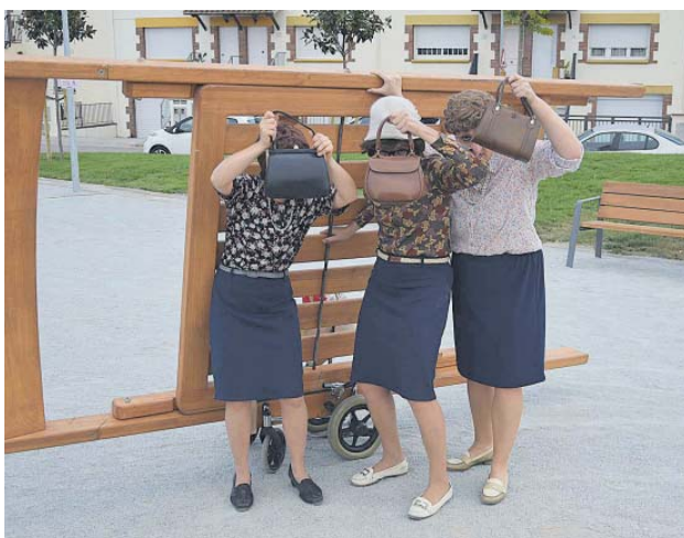
Espectacle a la Fresca, a la nova plaça de la Constitució