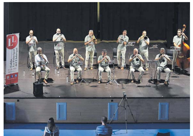
Audició de sardanes amb la Principal del Llobregat