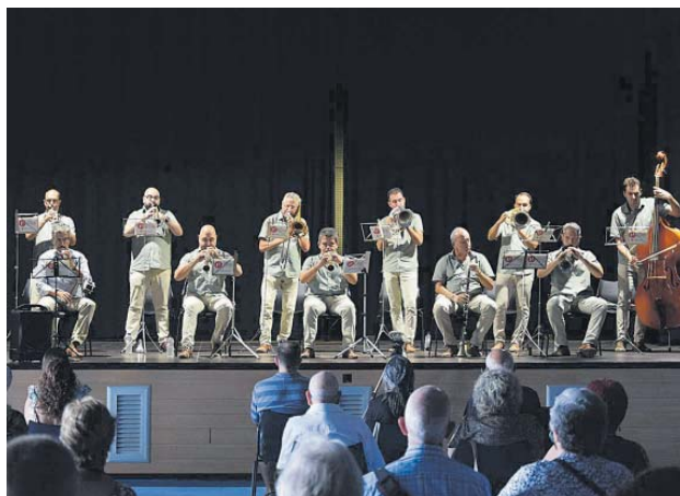
Audició de sardanes amb la Principal del Llobregat