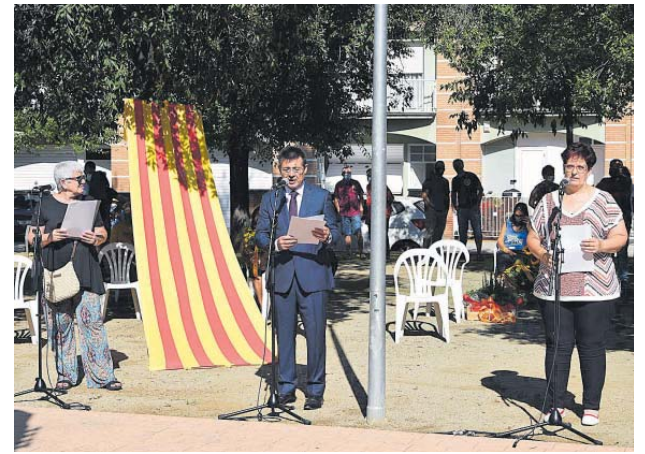
Presentació de l'acte de la Diada