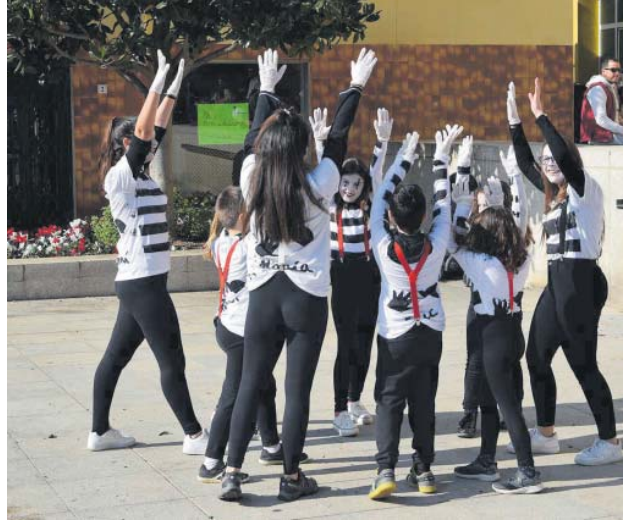
Rua del Carnasplai