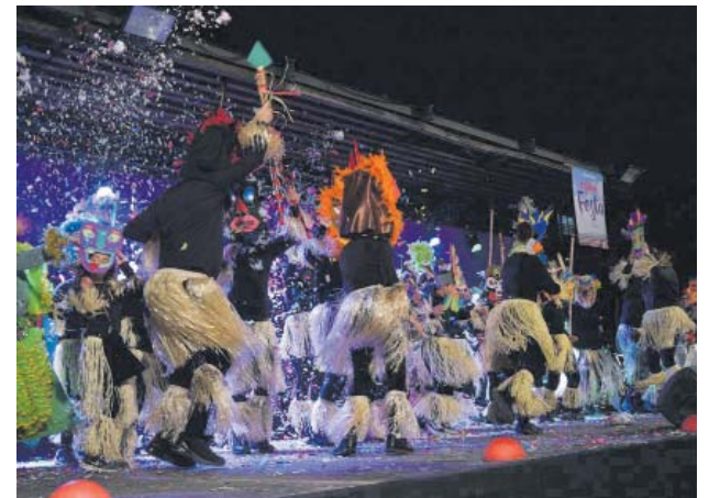
Actuació de comparses