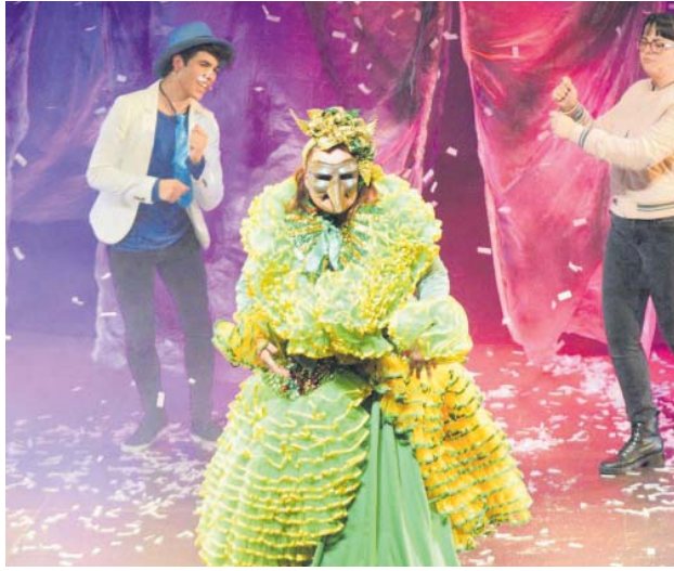
La Reina Carnestoltes 2020