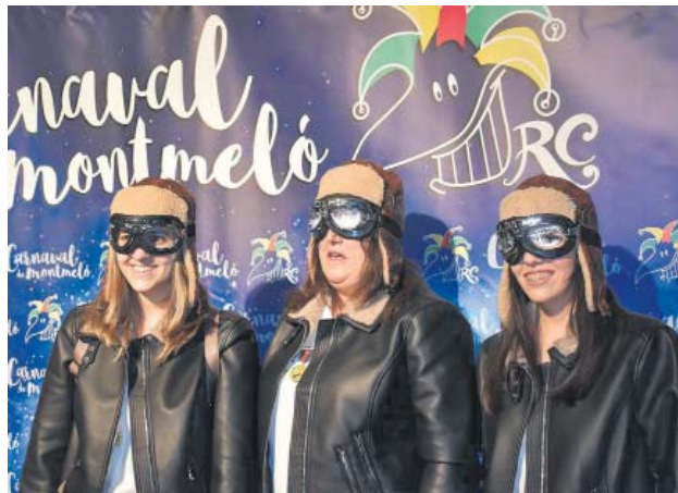
Les regidores també es disdressen