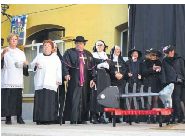
Enterrament de la sardina