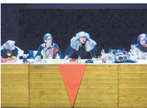
Judici a la Reina Carnestoltes