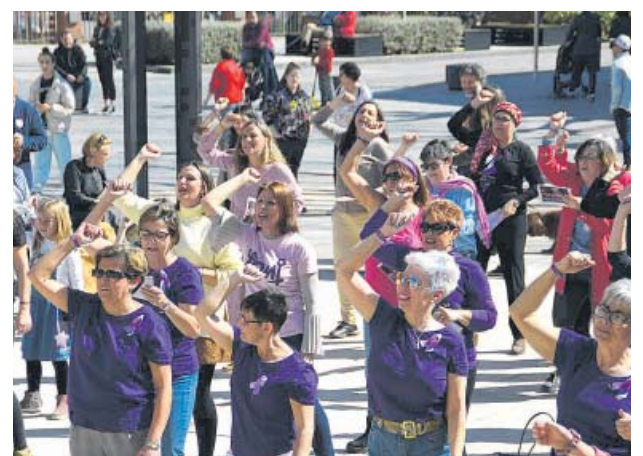
Coreografia de l'himne feminista Un violador en tu camino