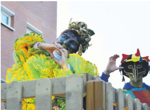
La Reina a la Rua