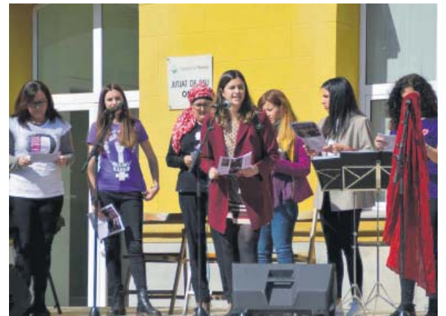
Lectura del manifest feminista del 8 de març