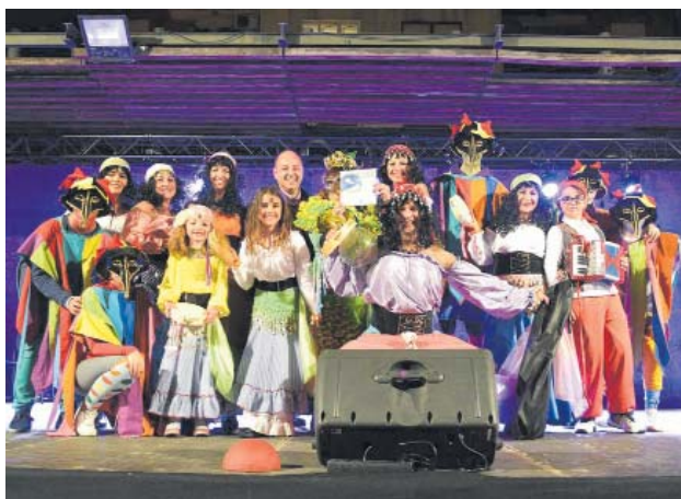
Premis de la Rua