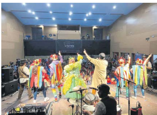
Ball infantil de Carnaval