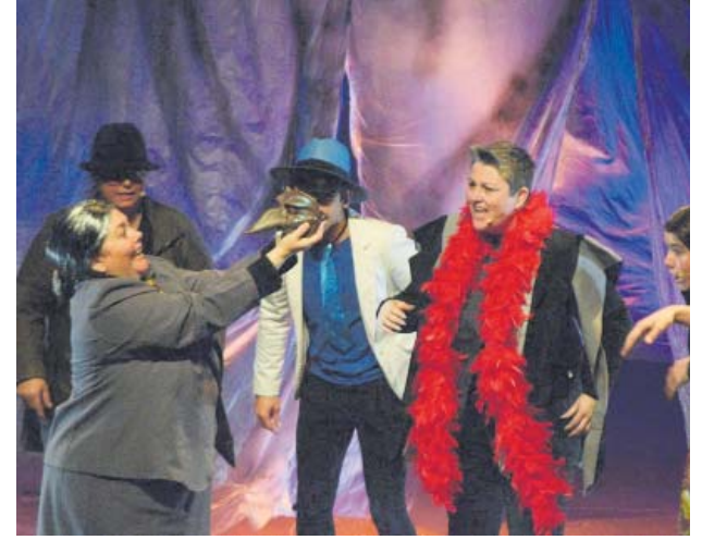
Arribada del Carnestoltes: la Vella Quaresma serà la nova reina