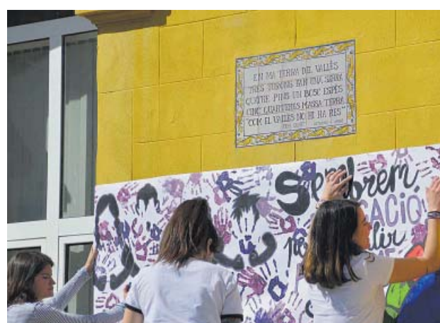
Joves montmelonines penjant una pancarta feminista