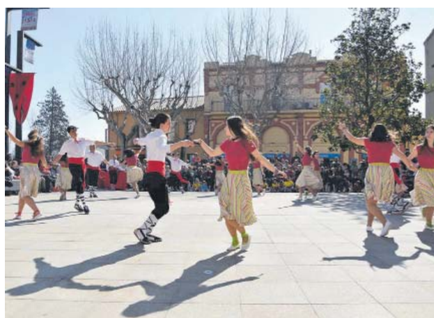
Ball de gitanes a la plaça de la Vila