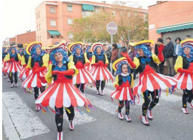
Rua de Carnaval