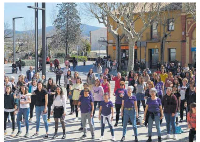
Coreografia de l'himne feminista Un violador en tu camino