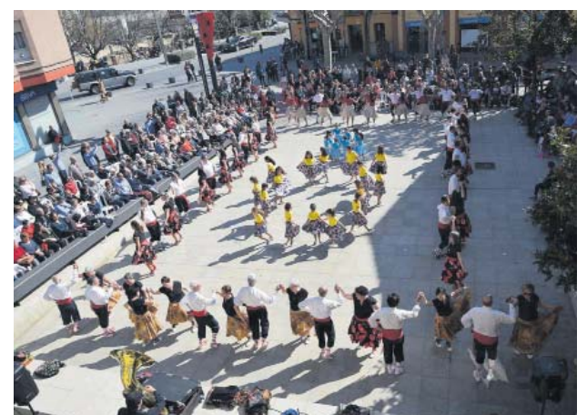
Ball de gitanes a la plaça de la Vila