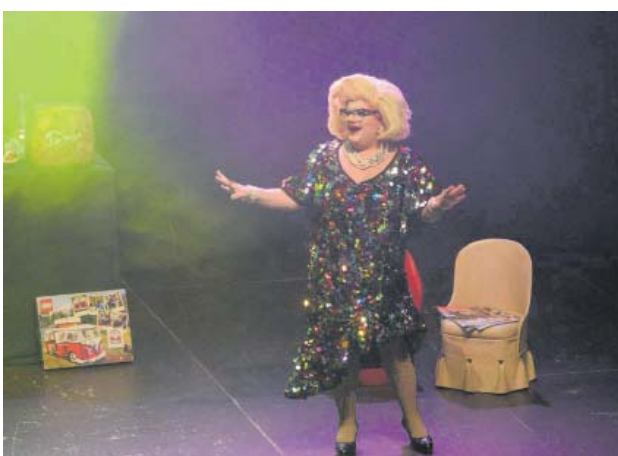
The Chanclettes a la Polivalent