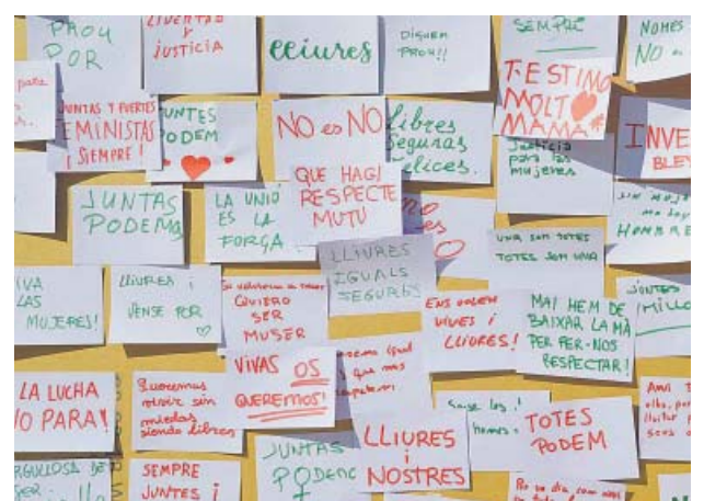
Missatges feministes de la ciutadania de Montmeló