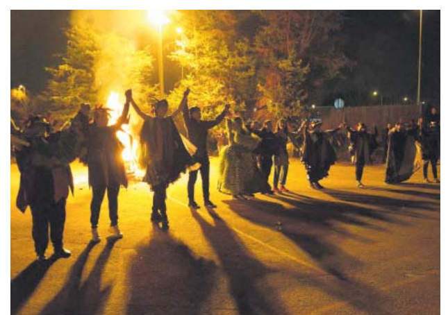
La Comissió per a la recuperació del Carnaval acomiada la festa