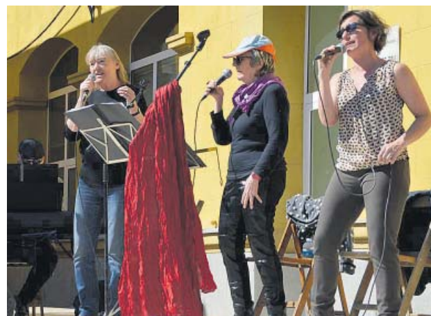
Recital Poesia en Jazz, a càrrec de Divadams