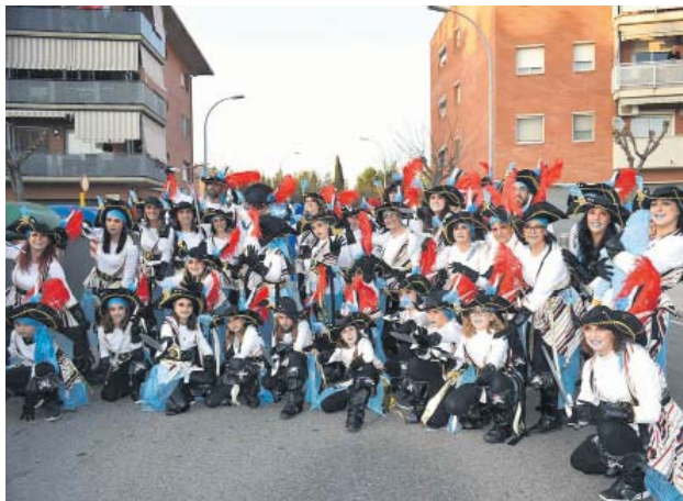
Comparsa a la Rua