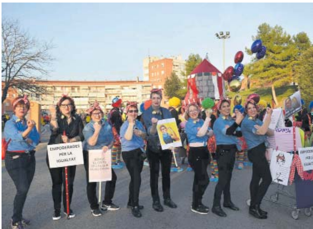
Grup a la Rua