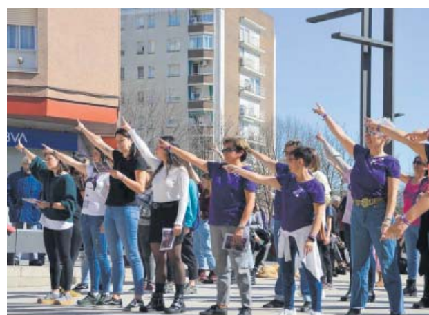
Coreografia de l'himne feminista Un violador en tu camino