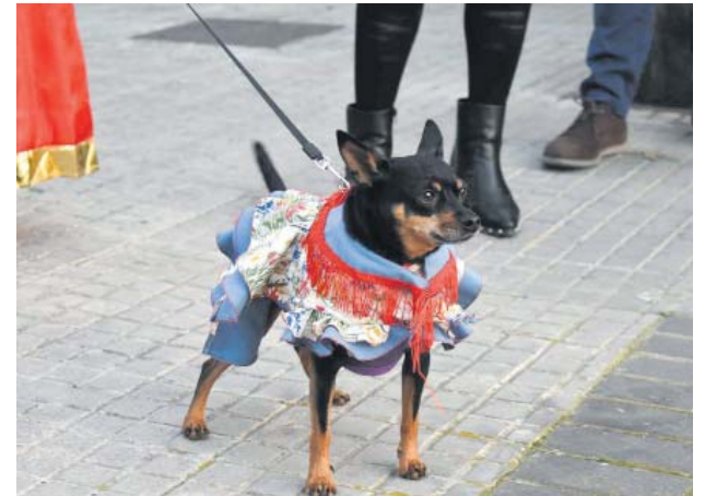
Tothom es disdressa