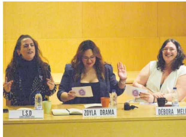
Teatre a la Concòrdia: Activistas de sofà, organitzat per ADMI