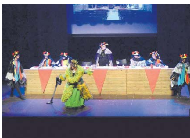
Judici a la Reina Carnestoltes