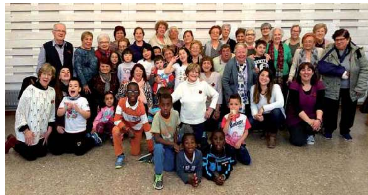
Actividad intergeneracional entre el Casal de la Gent Gran y l'Espai Socioeducatiu TOC

to activo de las personas de edad. Es un espacio abierto de relación social y de apren-