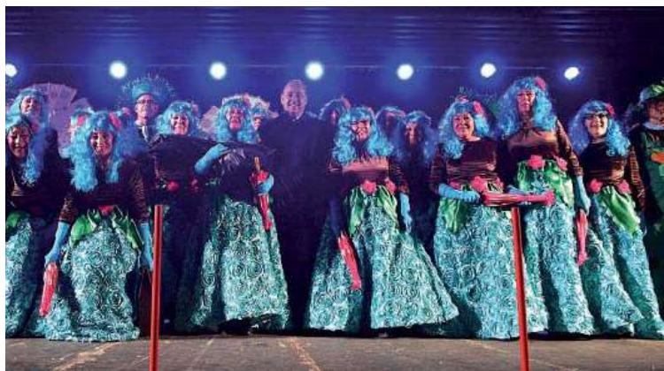
Participación del Casal de la Gent Gran en la rua de Carnaval

de Montmeló (CGGM) es un equipamiento municipal que promueve el envejecimien-