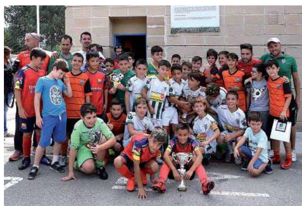
Foto de grup dels tres equips finalistes del torneig Isidre Vendrell: CF Montmeló, CF La Llagosta y CF Singuerlin