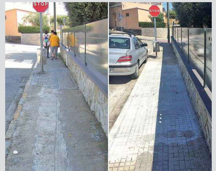
Vorera amb sotrats al carrer de Pelai

L'any passat es va fer una prova pilot d'aquesta iniciativa i ara l'Ajuntament ha volgut repetir l'experiència. Tot seguit, una mostra d'algun dels tres punts detectats a la Setmana Europea de la Mobilitat 2018 que ja han estat millorats.