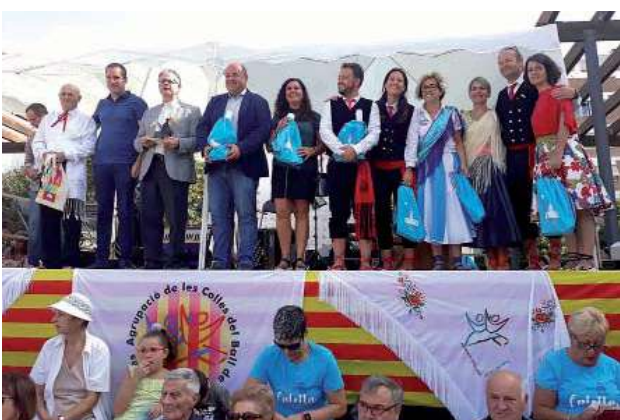
Acte institucional de nomenament de Calella com a Capital del Ball de Gitanes del Vallès 2019