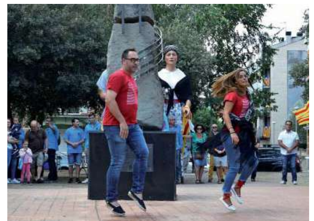
Ball d'Homenatge de la Colla de Gitanes de l'Agrupada