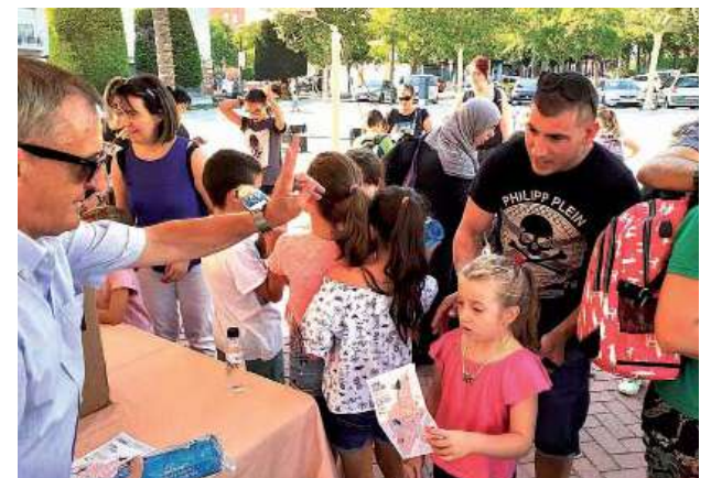
Entrega d'una ampolla com a obsequi per participar en el concurs del Camins escolars