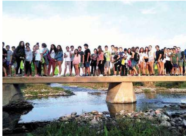
Caminada de l'Institut de Montmeló