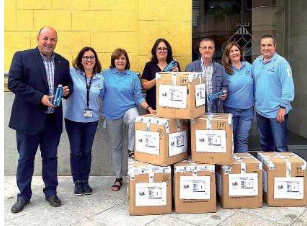
Corbion entrega l'ampolla d'obsequi dels "Camins Escolars"