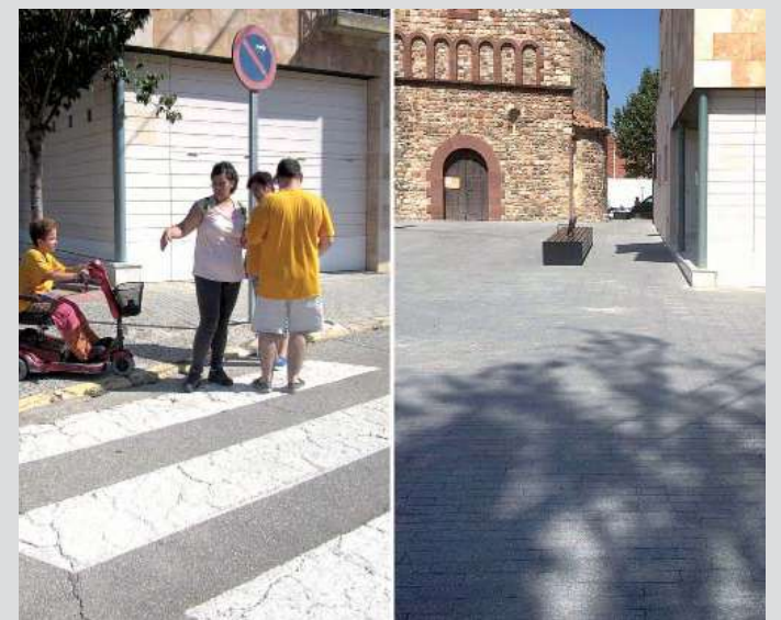
Rampa insuficient a la plaça de l'Església