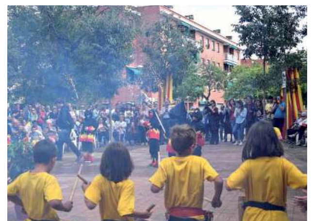
Actuació de la colla infantil del Diables de Montmeló