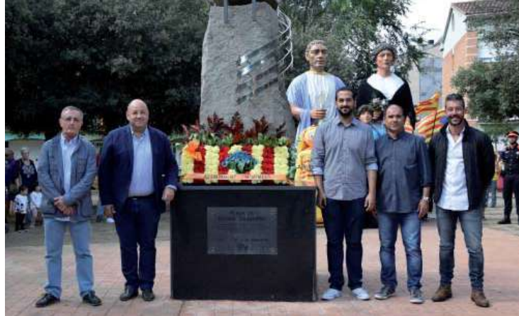
Ofrena floral dels representants de l'Ajuntament de Montmeló

Al matí, la plaça de Rafael Casanova va acollir l'acte institucional de la Diada de Catalunya a Montmeló, en el qual hi van haver representants de les quatre formacions polítiques del consistori –PSC, Canviem Montmeló, Fem Montmeló i ERC. El ball de gitanes de l'Agrupada va engegar un acte on hi va haver ofrenes florals al monument