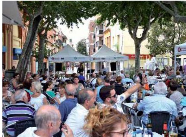
Concert vermut a Can Serra