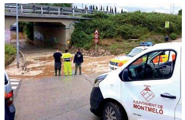
Actuació de Protecció Civil i personal de la Brigada Municipal diumenge 22 de setembre