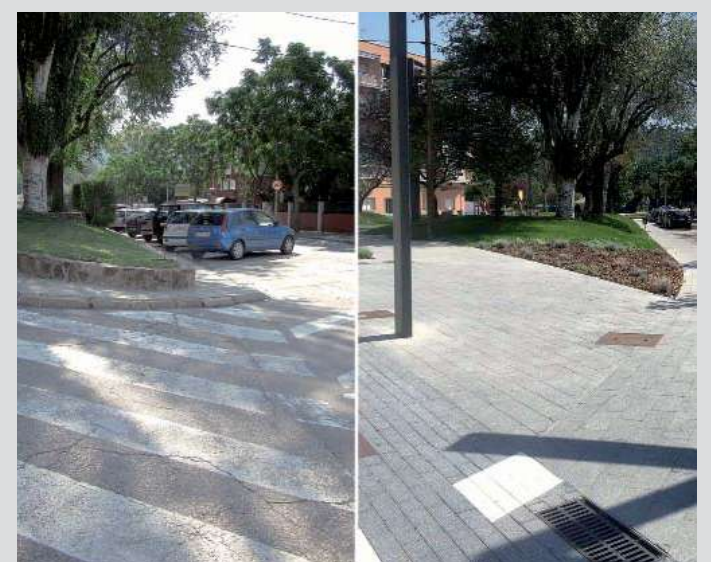
Pas de vianants sense rampa al carrer de Santa Maria