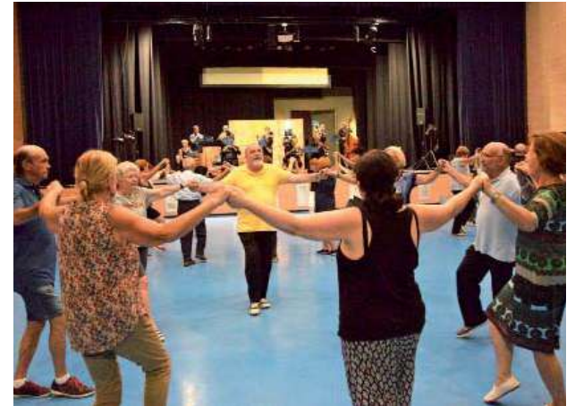
La ballada de sardanes va acabar a la Polivalent, degut a la pluja