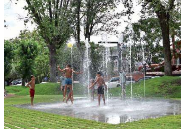
Espai d'aigua en el nou parc del carrer de Santa Maria