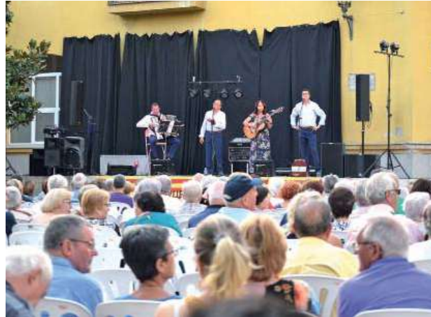
Havaneres i rom cremat a la plaça de la Vila