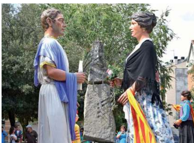
Ball dels Gegants de Montmeló