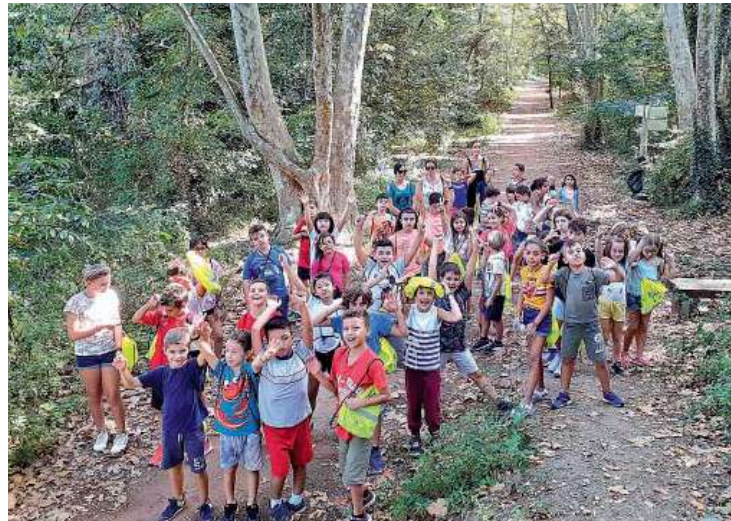
Caminada escolar (Sant Jordi)

Dilluns dia 16 s'ha posat en marxa la Unitat de Vigilància i Control de Contaminació Atmosfèrica que estarà en el municipi dos mesos davant l'Ajuntament. Dimarts han començat les caminades escolars; una quarantena d'alumnes de 3r de Pau Casals han realitzat una passejada pels camins dels pagesos i pel nou camí de les escoles. Dimecres, ha estat el torn de l'esco-