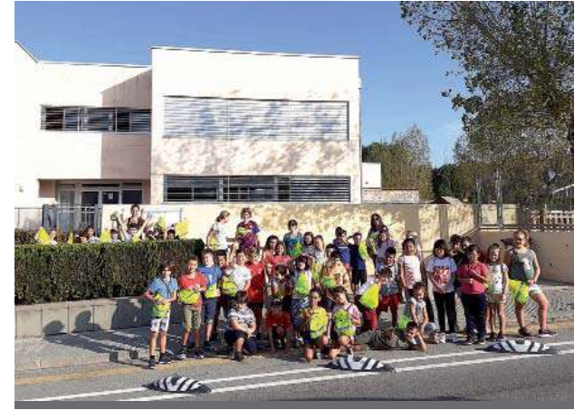
Caminada de l'escola Sant Jordi