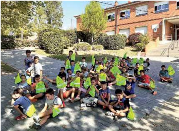
Caminada de l'escola Pau Casals