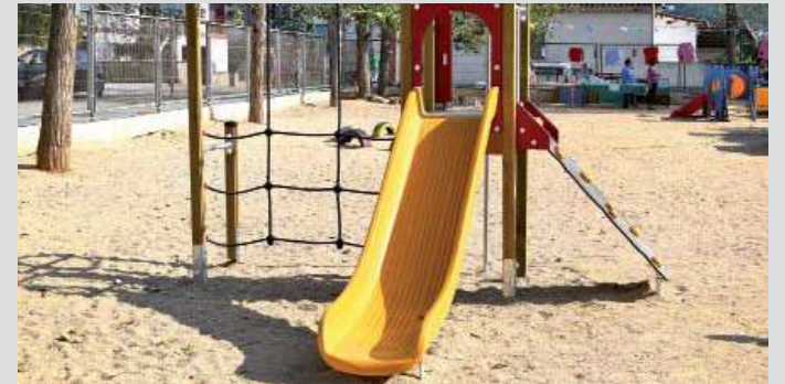
Instal·lació de jocs infantils a l'escola Sant Jordi

Aquestes darreres accions formen part dels pressupostos participatius del 2018 i donen per finalitzades les inversions previstes a les escoles, dins de les quals també es va dur a terme l'arranjament del talús de l'escola Pau Casals i la plantació d'arbres fruiters al pati de l'escola Sant Jordi.