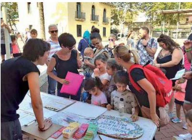
Taller "Quin soroll que fem" a la plaça de la Quintana