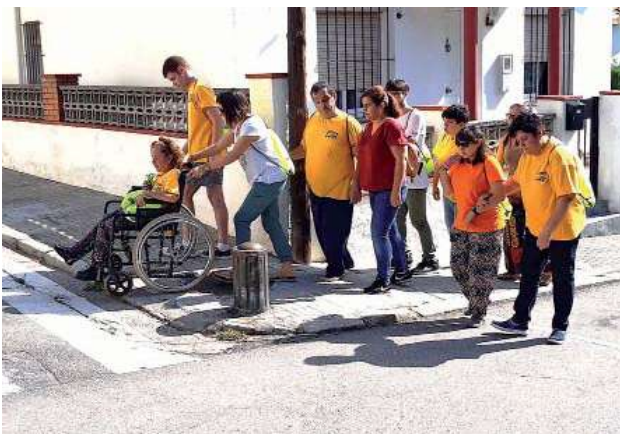
Persones usuàries del Trencadís passen per Montmeló per detectar barreres arquitectòniques