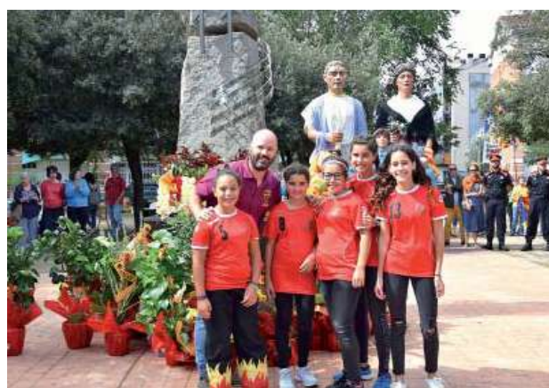
Ofrena floral per part de les entitats, partits i ciutadania (Penya Blaugrana de Montmeló)