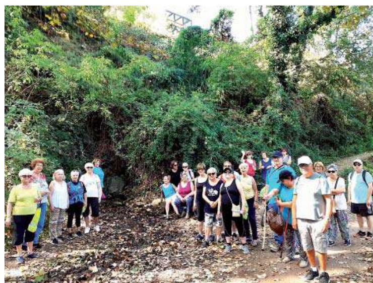
Caminada del Casal de la Gent Gran

Dissabte 21, per motius de pluja s'ha anul·lat la Pedalada i la botifarrada que organitzava Sobrebici. Aquesta activitat es realitzarà durant el mes d'octubre. Per últim, diumenge dia 22, més de cinquanta persones han participat en la marxa nòrdica organitzada per l'àrea de Salut Pública. La caminada va transcórrer al costat de la llera del riu des de la passera de Simón Rosado fins a Montornès Nord per pujar fins al turó de Can Tacó i acabar a la plaça de la Vila. Aquesta ha estat l'última activitat de la Setmana de la Mobilitat a Montmeló.