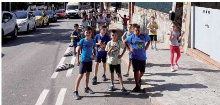
Caminada escolar per la zona del camí entre les escoles Sant Jordi i Pau Casals

La multinacional productora d'àcid làctic establerta a Montmeló, col·labora des de fa molt temps amb un gran nombre de tallers i activitats relacionades amb la sostenibilitat, l'ecologia i el reciclatge. Fruit d'aquesta estreta col·laboració entre Corbion i l'administració municipal són els tallers que ofereixen durant la Castanyada i el Parc de Nadal, o els patrocinis en actes de la Festa Major.