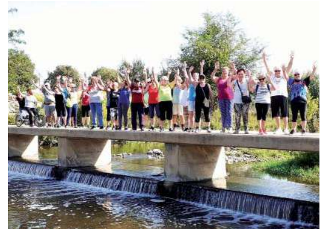
Caminada del Casal de la Gent Gran