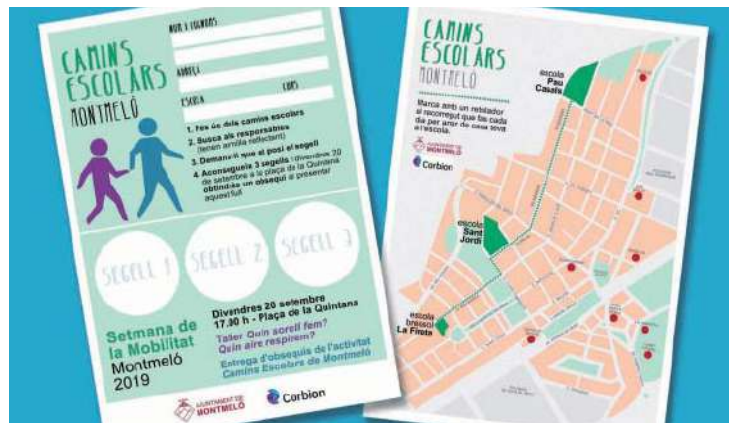
Targeta del Joc de "Camins Escolars"

Del 16 al 22 de setembre s'han realitzat tot un seguit d'activitats al voltant de la mobilitat. Una d'elles ha estat donar a conèixer el bon ús dels nous camins escolars. Per això, tots els infants de les escoles de primària han rebut una targeta. Al llarg dels camins escolars, les persones representants de l'Ajuntament segellaven les targetes a tots els escolars que ho demanaven. Un cop segellada tres vegades, la targeta s'havia d'omplir amb les dades personals i dibuixar el recorregut que cada infant fa de casa fins a l'escola. Aquesta targeta servirà com a base de dades per crear noves i futures ramificacions de l'actual recorregut dels camins escolars.