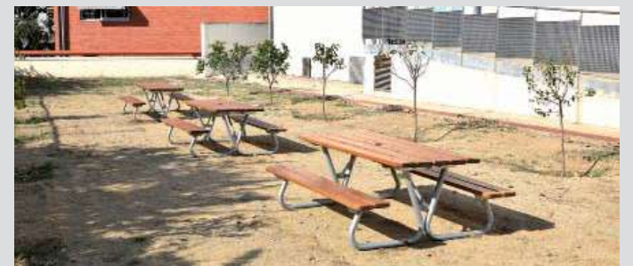
Taules de pícnic a la zona de l'hort de l'escola Sant Jordi