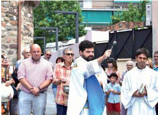
Benedicció de la nova plaça de l'església