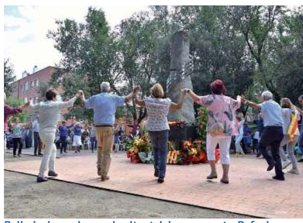
Ballada de sardanes al voltant del monument a Rafael Casanova