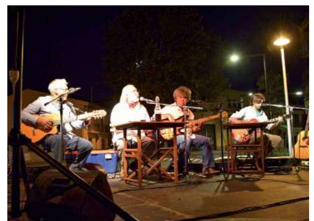
Concert de taverna a la llosa de soterrament