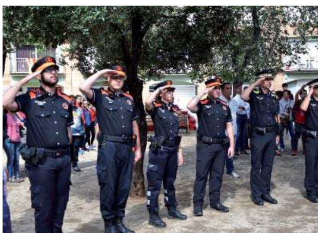
Cant dels Segadors a la plaça Rafael Casanova