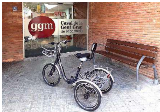
Persones usuàries del Casal de la Gent Gran han provat un tricicle elèctric