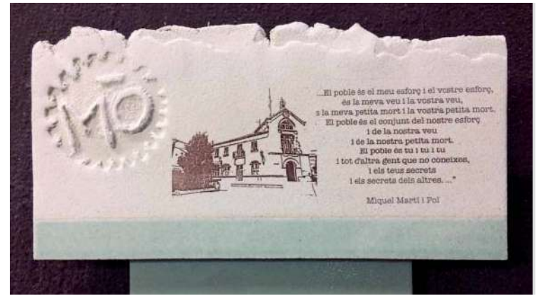
Peça de ceràmica exclusiva elaborada pel comiat dels regidors i regidores

Els portaveus de cadascun dels grups polítics van adreçar unes paraules d'agraïment als seus companys i companyes i els càrrecs electes, en el seu torn, van agrair a la ciutadania, als treballadors municipals i als