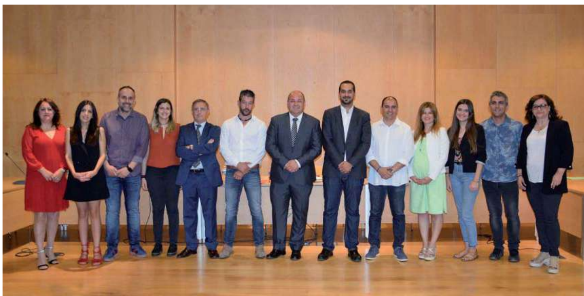
Actual composició del Plenari de la legislatura 2019-2023

Dissabte 15 de juny a les 12 del migdia, amb una Sala de la Concòrdia plena a vessar, es va celebrar el Ple de constitució de l'Ajuntament per a la legislatura 2019-2023.