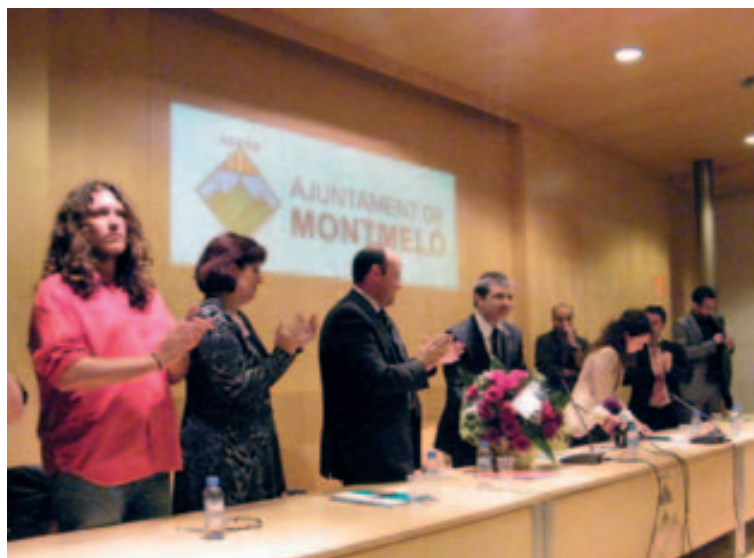
Presa de possessió del 26 d'abril de 2010

Aquest dissabte passat vaig fer efectiva la renúncia a l'alcaldia de l'Ajuntament de Montmeló. Tanco un llarg període lligat a l'ajuntament que vaig començar el 1987 i en el que en dues etapes ben diferents m'ha ofert l'oportunitat de treballar per a la ciutadania del nostre poble des d'aquesta institució. Una decisió meditada que em permetrà recuperar la meva activitat professional dels últims 20 anys a l'empresa privada