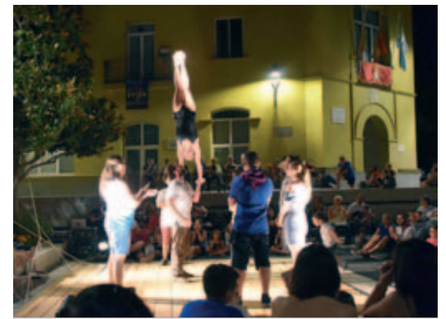
Espectacle Espera a les nits golfes familiars