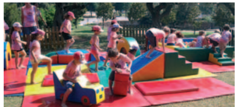
Activitat amb aigua pels més petits

sigui a la piscina o en altres espais, per combatre la calor i passar-ho molt bé.