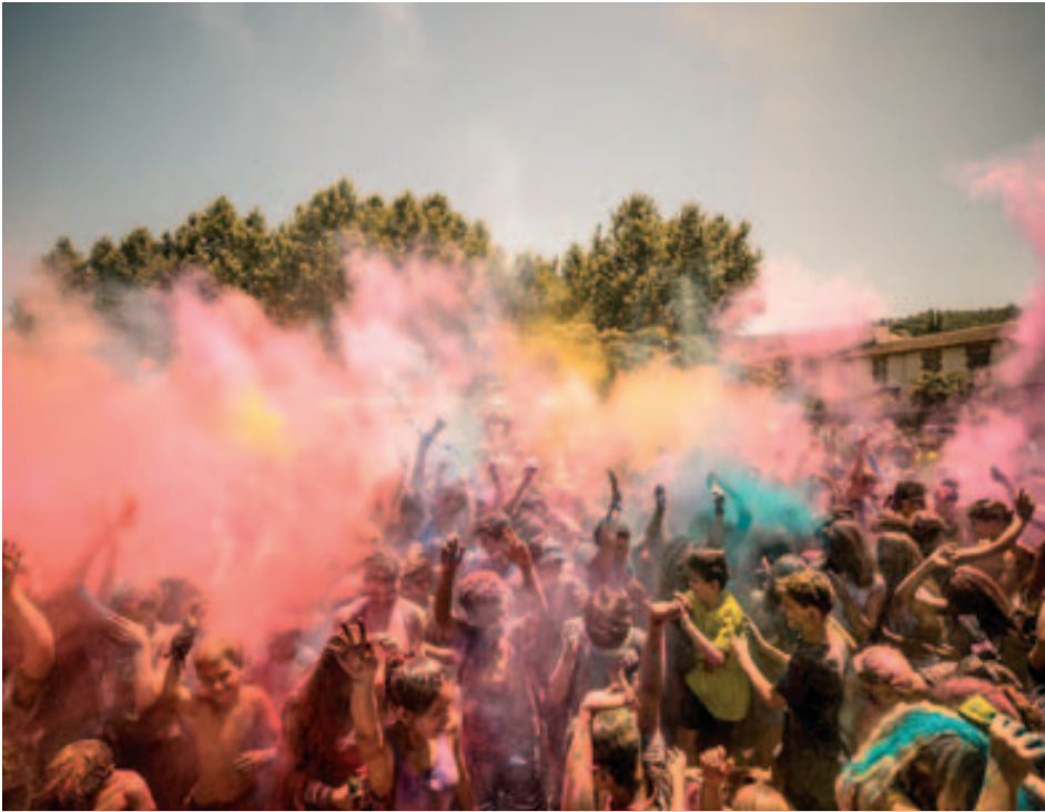
Festa Holi Dolly