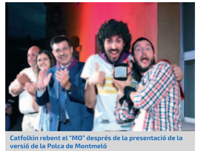
Catfolkin rebent el "MO" després de la presentació de la versió de la Polca de Montmeló