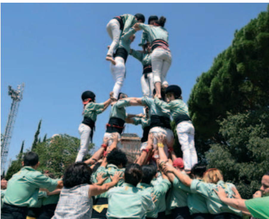
Castellers de Mollet a la Torreta