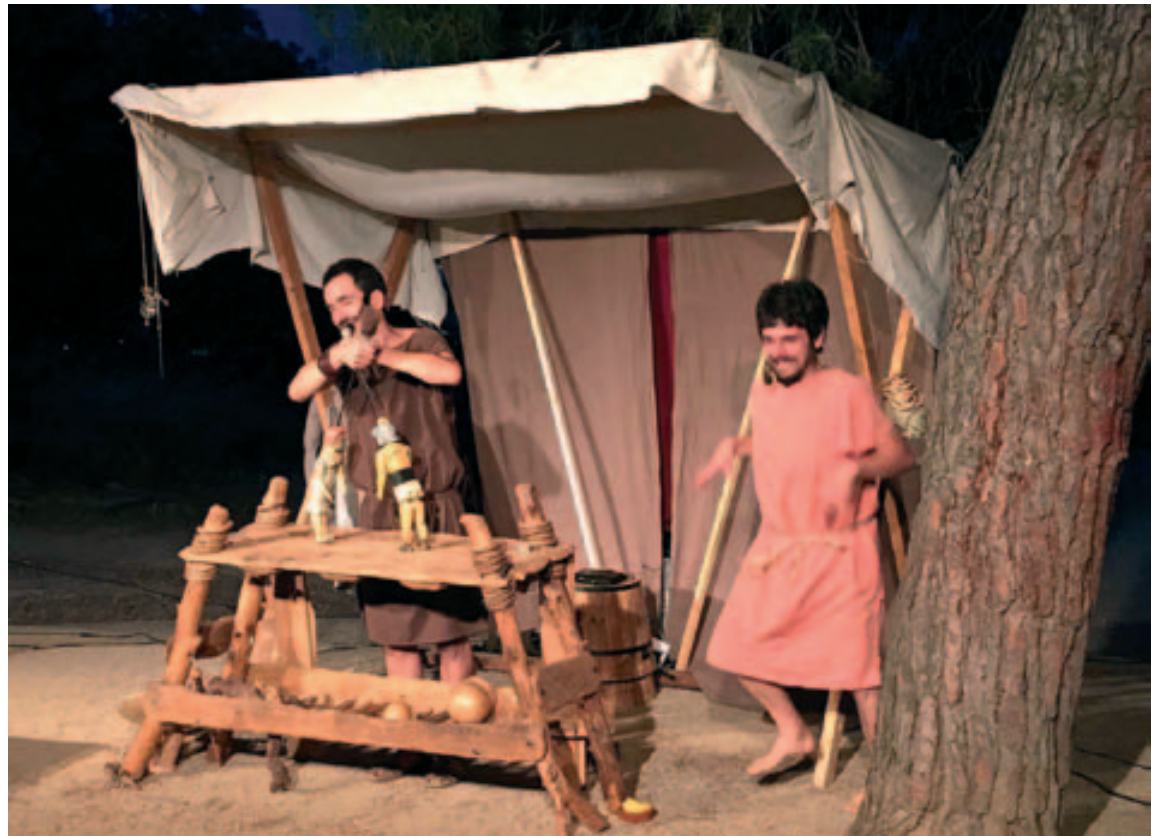
Espectacle teatral Gladius i Medulina