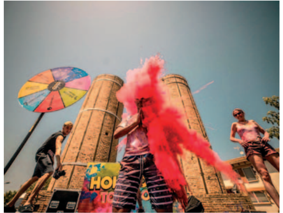
Festa Holi Dolly