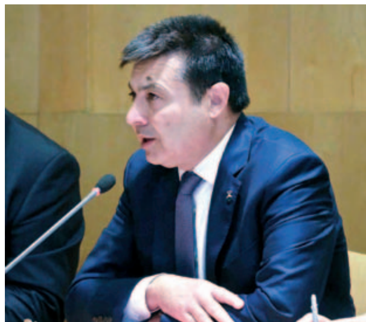
Ple de renúncia del 14 de juliol de 2018

És evident que la satisfacció d'un responsable mai és plena, hi ha assumptes que m'agradaria haver resolt i que no ha estat possible per circumstàncies diverses. Un d'aquests és l'habitatge i per a gent jove, el conveni signat aquest any amb l'Incasòl per a dotar-nos de pisos de protecció oficial en règim de llo-