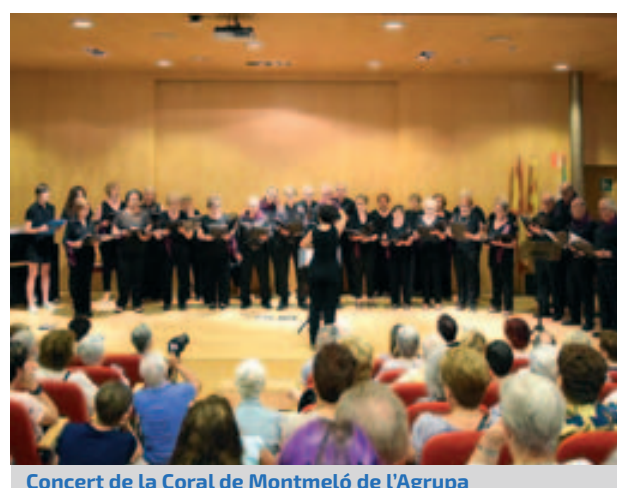
Concert de la Coral de Montmeló de l'Agrupada