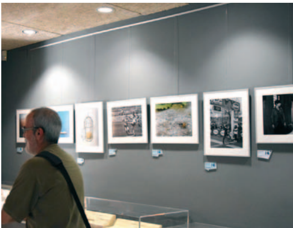
Exposició fotogràfica "Superant barreres" al Museu