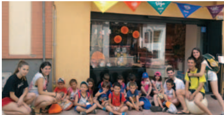
Aprenent l'ofici de carnisser a Can Manils

A més de totes aquestes activitats, cada dia hi ha diferents tallers, excursions, gincanes i aigua, molta aigua, bé