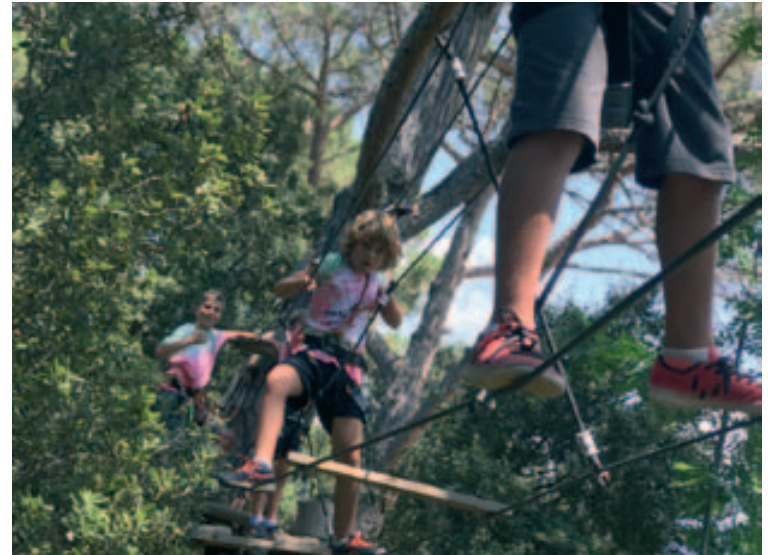
Excursió a Aira Natura

El casal es va posar en funcionament el 25 de juny i s'arriba ara a l'última setmana d'activitats. Aquest proper divendres 20 de juliol finalitzarà el Casal d'Estiu 2018 amb una participació de rècord: 322 infants. Molts dels monitors i petits que aquests dies han participat al Casal, tornaran a trobar-se dos dies després, per anar de Colònies d'Estiu o de Camp de Treball durant una setmana. ■