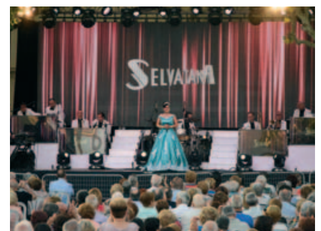
Concert de festa Major de l'Orquestra Selvatana