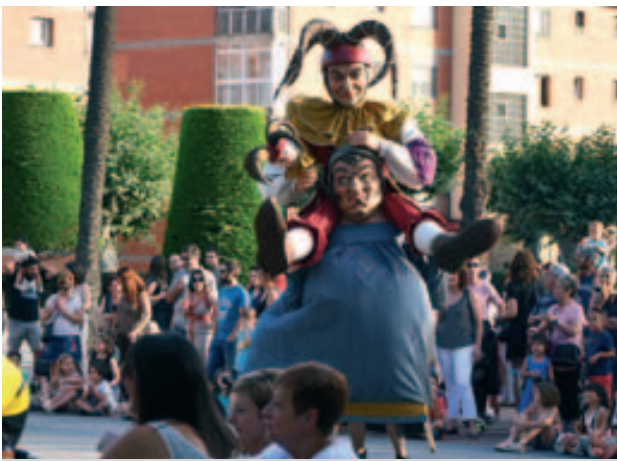
Ball de gegants