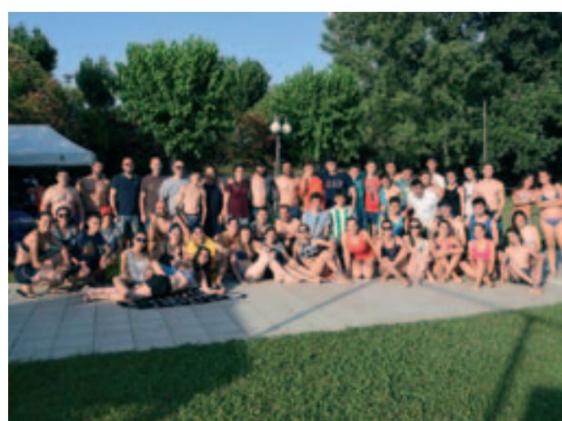
Foto de grup de les persones participants al Xip-xap