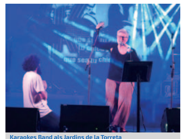
Karaokes Band als Jardins de la Torreta