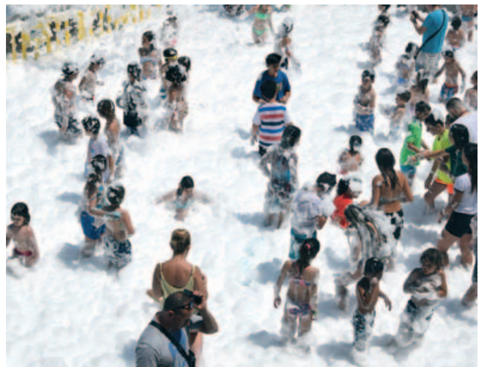
Festa infantil de l'escuma