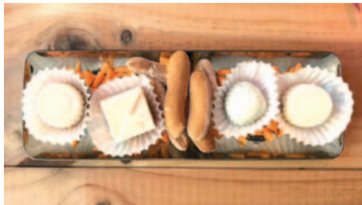
Tapa de 'bombons', guanyadora del 6è Circuit de Tapes de Montmeló

L'artífex d'aquesta tapa és l'Ignasi Manils, la tercera generació familiar de la carnisseria, un jove molt creatiu i dinàmic que conjuntament amb els seus pares ha reinventat i actualitzat l'establiment familiar. "Els bombons els vam elaborar fent una gelatina de formatge, amb diferents varietats, fonent-los i barrejant-los amb crema de llet i una mica de sucre. Cada tipus de bombó el farcïem amb diferents