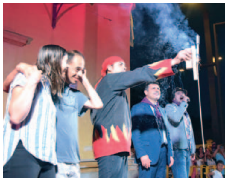
Traca inicial de Festa Major

L'espai dels jardins de la Torreta ha estat protagonista de grans moments durant els concerts pel públic jove: divendres Karokes Band va descobrir més d'un talent musical amateur i dissabte, la Torreta va viure una llarga nit amb l'actuació de "Los 80 principales". L'espai va quedar petit durant algunes hores. I diumenge al matí els jardins es va omplir d'activi-