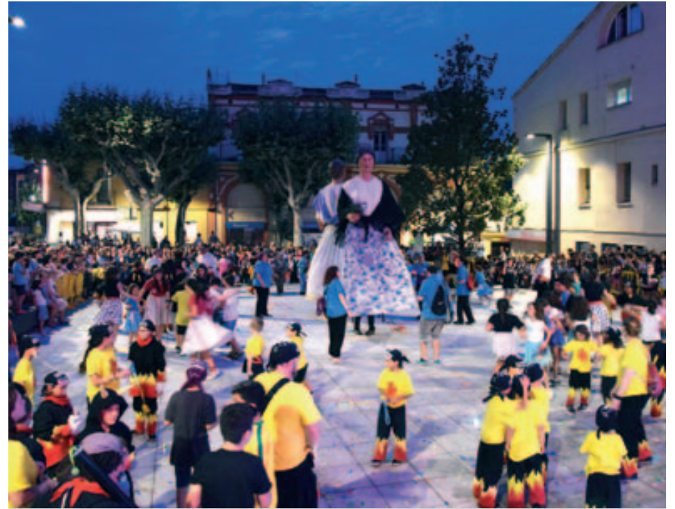
Ball d'inici de Festa Major a la Plaça de la Vila