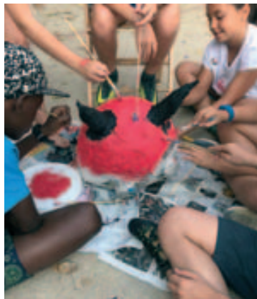
Taller de capgrossos i diables