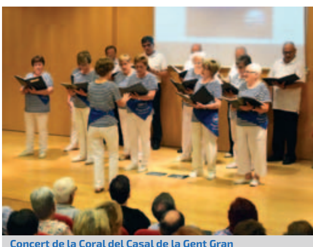
Concert de la Coral del Casal de la Gent Gran