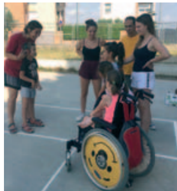
Gimcana preparada pels usuaris del Centre Ocupacional El Trencadís