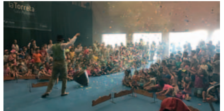
Actuació del Senyor de les Baldufes