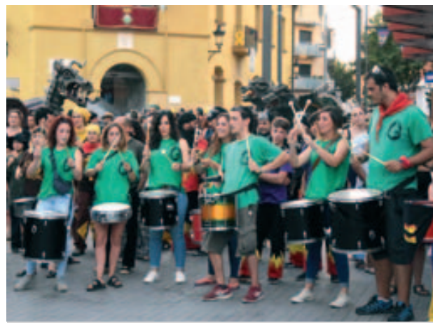
Tabalada a la plaça de la Vila