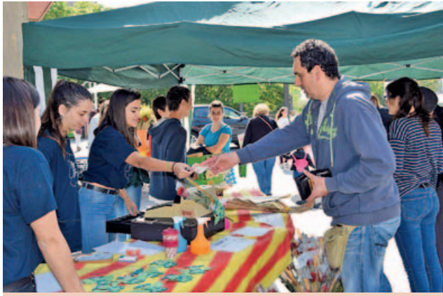
Una de les diferents parades de roses i articles d'artesanaria que cada any participen en la Diada.

umenge. Això ha afavorit la gran aflluència de la dia, a les diferents activitats que s'han realitzat ers, jocs infantils, ball de gitanes, catifes de sal,