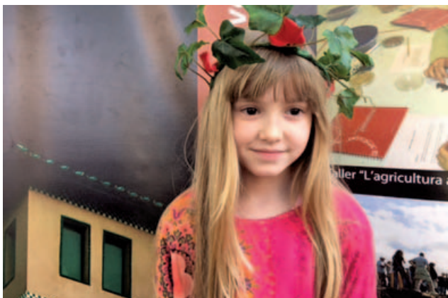
El Museu de Montmeló va organitzar un taller de corones de flors que va tenir gran participació de la mainada.