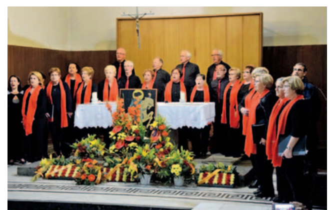
A la tarda, la Coral de l'Agrupació va amenitzar l'ofrena floral a Sant Jordi a l'església Santa Maria