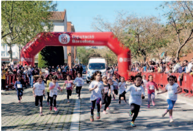
303 infants van participar en aquesta edició de La Mini de Montmeló, una competició clàssica pel públic més petit i familiar.

Coincidint amb la celebració del Dia Internacional de l'activitat física el 6 d'abril, la regidoria d'Esports va organitzar tot un seguit d'activitats relacionades amb l'esport i la salut. A això s'han d'afegir alguns triomfs d'entitats esportives durant el final d'aquesta temporada, com és el cas dels escacs i del futbol.