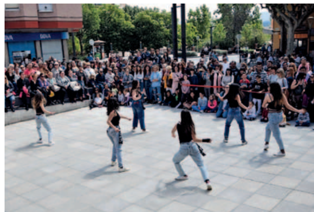
Per segon any consecutiu, les escoles i entitats de dansa de Montmeló, celebren juntes aquest dia dedicat a la dansa.