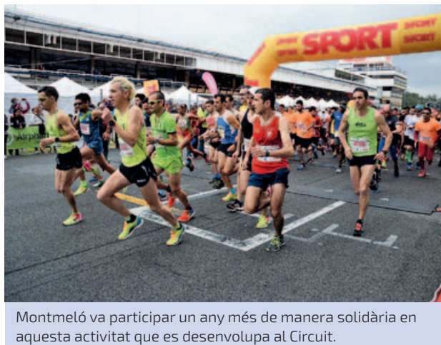
Montmeló va participar un any més de manera solidària en aquesta activitat que es desenvolupa al Circuit.