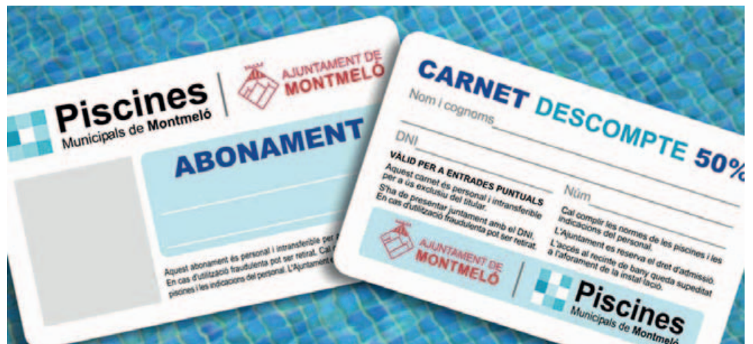
Abonament i Carnet descompte 50% de les Piscines Municipals de Montmeló

La temporada de piscines s'obrirà dilluns 26 de juny i tancarà la temporada el 3 de setembre. Ja es pot sol·licitar a l'OAC, l'abonament de temporada o el de 10 banys. També hi ha un carnet de descompte del 50% per a les persones que es troben en situació d'atur. Per a realitzar un nou abonament s'ha d'emplenar la sol·licitud corresponent i fer el pagament bancari. Per la seva banda, la renovació de l'abonament de la temporada anterior es pot fer on-line, mitjançant un formulari en la web municipal ( www.montmelo.cat ). ■