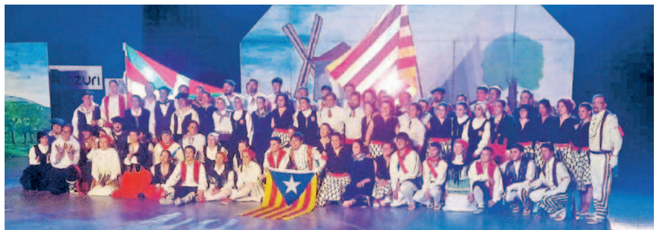
La colla gran de Gitanes de Montmeló van participar al Herrien Jaialdia (Festival dels Pobles) a Getxo, tornant la ballada al grup Itxas Argia.