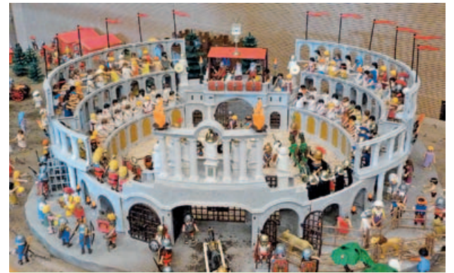
La Sala Polivalent es va omplir de playmobils durant un cap de setmana, amb parades, playmobils gegants i diorames com aquest espectacular Coliseu.