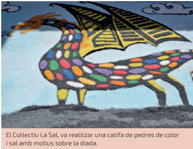
El Collectiu La Sal, va realitzar una catifa de pedres de color i sal amb motius sobre la diada.