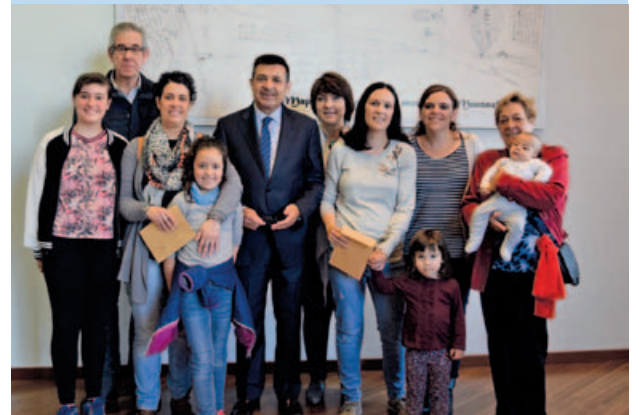
Lliurament sorteig entrades Fórmula 1

Montmeló s'hi aboca per tal de donar servei. Des de l'arribada a l'estació personal d'informació municipal, a més d'informar, adrecen els visitants fins a la parada d'autobusos llançadores que es troba a la plaça d'Ernest Lluch o els assenyalen el camí per arribar fins al Circuit. Els punts d'informació es situen a l'estació i a la plaça d'Ernest Lluch, a Montmeló és el sisè any consecutiu que es presta aquest servei amb un resultat molt satisfactori per als usuaris.