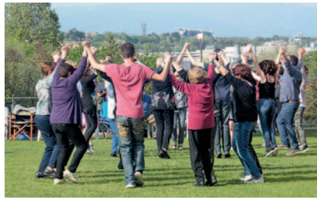
Tercera edició de l'Aplec de la Sardana de Montmeló que enguany es va celebrar el Diumenge Sant, amb gran participació de públic.