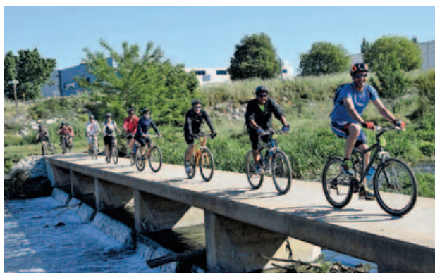
La popular bicicletada de Granollers fins al Fòrum, per la llera del Besòs, al seu pas per Montmeló