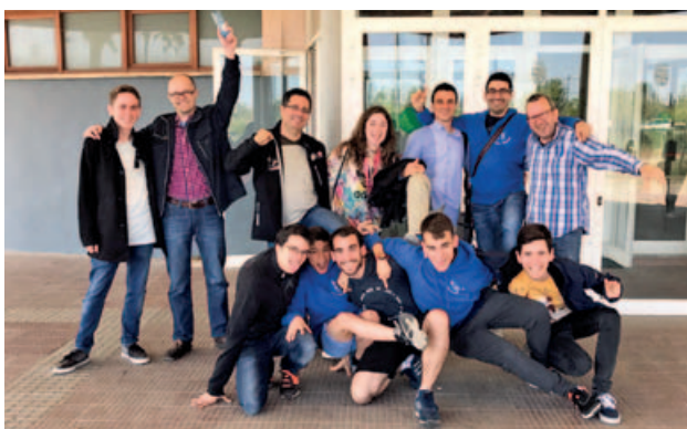
El Club d'Escacs Montmeló celebra que conservaran la categoria a 2a divisió de la lliga Catalana, durant la darrera jornada.