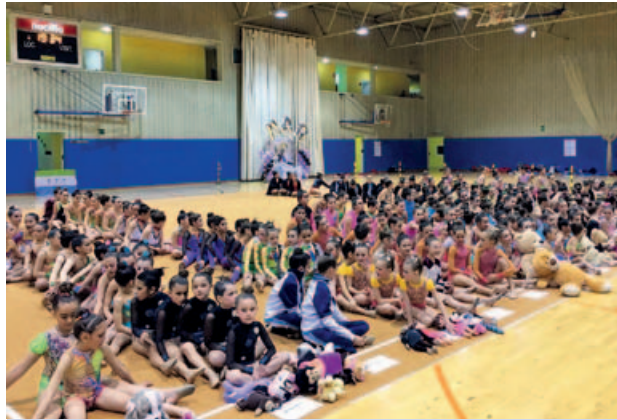
El pavelló acull un any més la final comarcal de Rítmica amb una àmplia participació de gimnastes i un gran nivell esportiu.