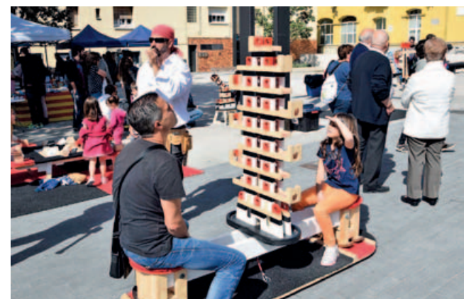
Diferents jocs de gran format, inspirats en el món dels castellers, van estar exposats durant tota la jornada perquè les famílies poguessin jugar.