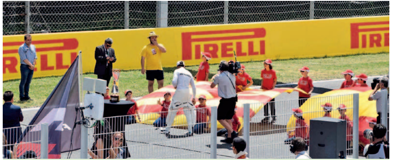
L'acte de les banderes, previ a la sortida de Fórmula 1 va estar amenitzat per infants de diferents entitats esportives locals. Hamilton va sortir de la fila de pilots per saludar a cadascun dels infants.

El teixit associatiu de Montmeló, participa de les diferents manifestacions socials i culturals que es fan al nostre poble i fora d'ell.