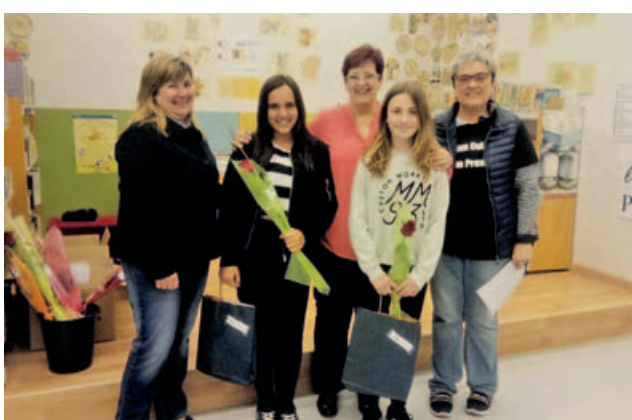
El dia 28 va tenir lloc l'entrega del concurs de punt de llibre d'enguany, a la biblioteca.