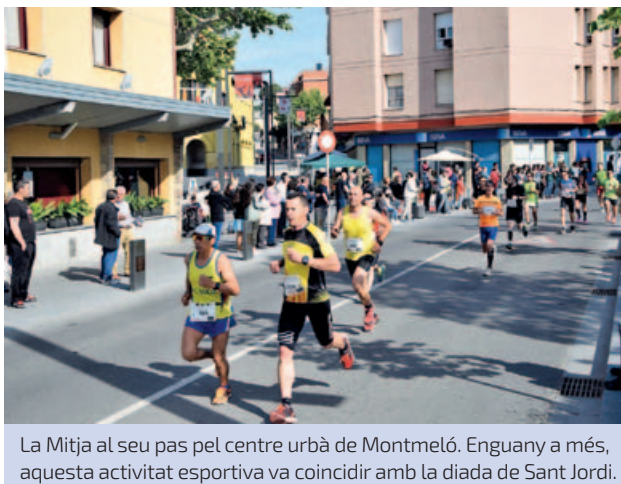
La Mitja al seu pas pel centre urbà de Montmeló. Enguany a més, aquesta activitat esportiva va coincidir amb la diada de Sant Jordi.