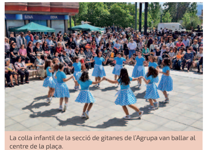
La colla infantil de la secció de gitanes de l'Agrupació van ballar al centre de la plaça.