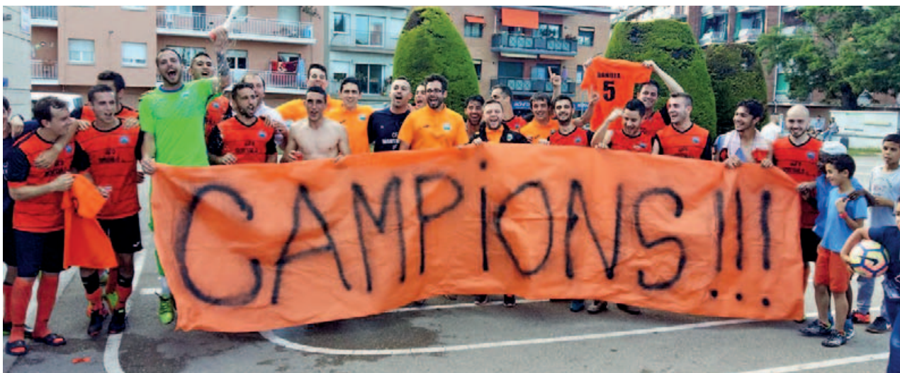
El passat cap de setmana, el CF Montmeló UE es proclamava campió del seu grup i tornen de nou a Tercera Catalana.