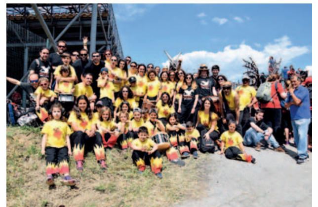
Una hora abans del Gran Premi de Fòrmula 1, els diables de Montmeló, van sortir a pista amb la seva bèstia, el Vibrot.